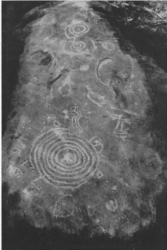
Abb. 4. Sils i. D., Carschenna. Gesamtansicht von Platte V.

am besten, weil sie kein durch Nachzeichnen subjektiv verfälschtes Bild ergibt. Nach mehrmaligem Überpinseln mit dem Gemisch wird der Fels mit einem sauberen Schwamm abgetupft, wobei die Kreide nur noch in den Vertiefungen sitzen bleibt und nachträglich mit Wasser wieder ausgeschwemmt werden kann. Zeichnung und Photographie werden gegenwärtig ergänzt durch großflächige Kunststoffabgüsse mit Gipsform.