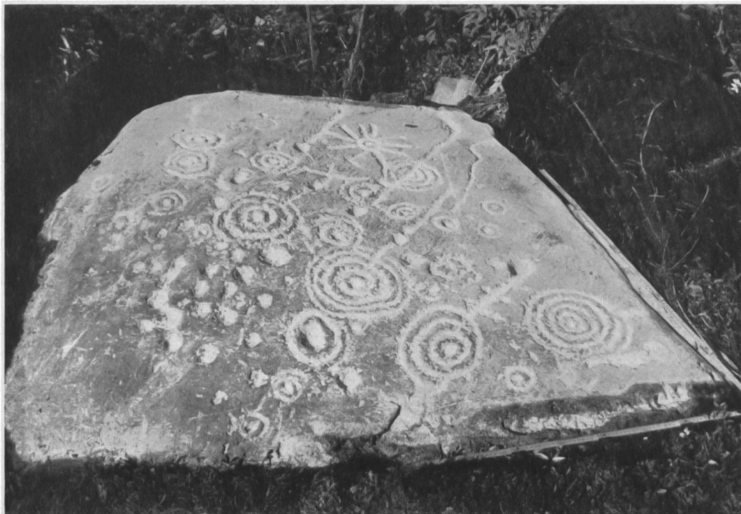
Abb. 6. Sils i. D., Carschenna. Gesamtansicht von Platte III, mit «Strahlenrad».