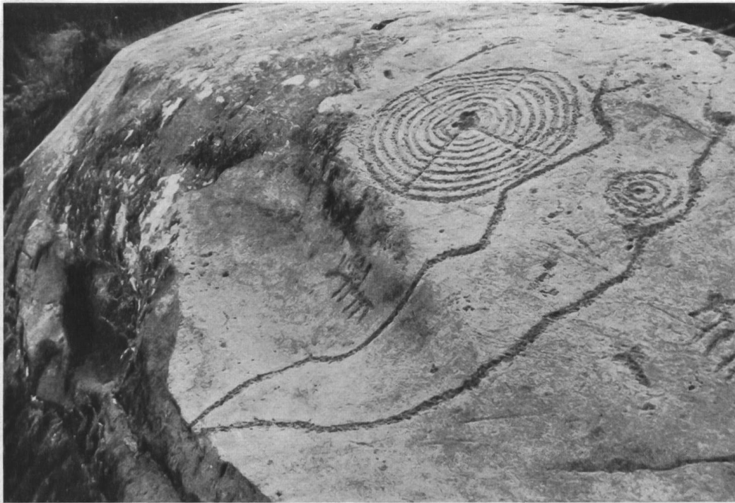
Abb. 3. Sils i. D., Carschenna. Die rundgeschliffene Felskante bei Platte II (man beachte die beiden Reiter).