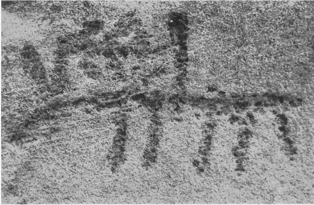
Abb. 5. Sils i. D., Carschenna. Detail aus Platte II: Reiter.