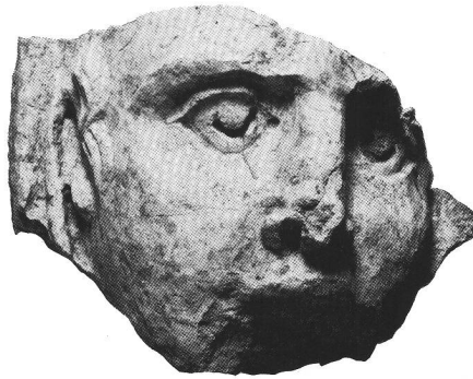
Zone du Forum. Tête en calcaire d'un homme sacrificiant. Hauteur 16 cm.

Il s'agit, d'après M. Bossert, des restes d'une statue humaine proche de la grandeur naturelle, en calcaire du Jura. Ce fragment de tête est conservé sur une hauteur de 16 cm. Les traits caractéristiques du visage évoquent un homme, la tête légèrement tournée vers sa droite. Des plis de tissu encadrent le visage, ce qui indique que l'hom-