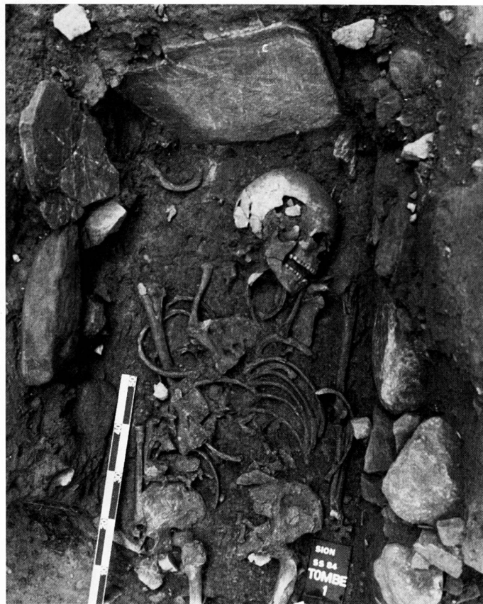
fig. 3 Sion, Sous-le-Scex. Tombe avec entourage de dalles. Bronze ancien. Von Steinplatten umstelltes Grab aus der frühen Bronzezeit. Tomba delimitata da lastre. Età del Bronzo iniziale.

Les fouilles de ce sondage se poursuivent actuellement en surface d'un niveau à gros galets fluviatiles. Le matériel récolté dans ces divers niveaux et notamment l'abondance de la faune montre que nous sommes en présence de niveaux d'habitations. Les nombreuses sépultures rencontrées nous apprennent pourtant que la base du rocher était également une zone funéraire