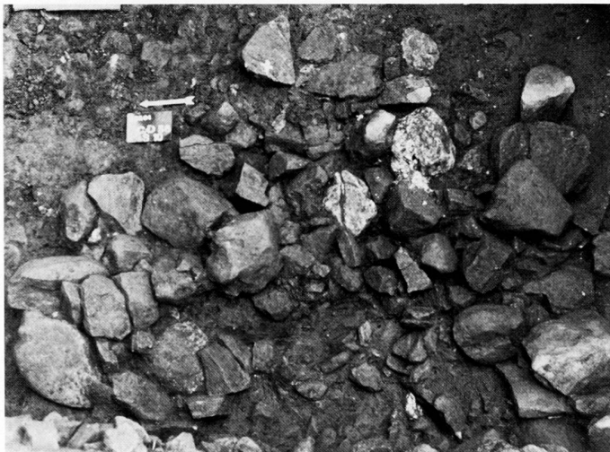
fig. 2 Sion, Sous-le-Scex. Foyer en cuvette. Néolithique moyen. Herdstelle aus dem mittleren Neolithikum. Focolare del Neolitico medio.