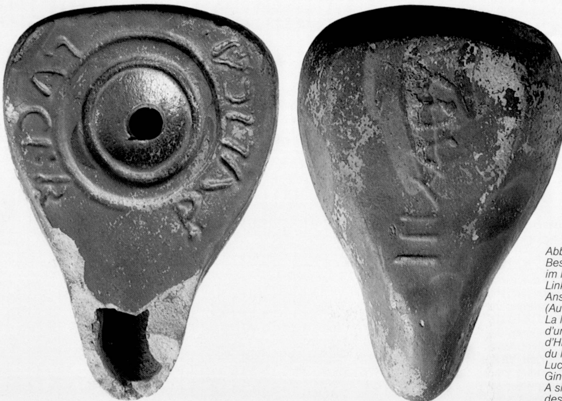
Abb. 1 Beschriftete römische Tonlampe im Musée d'Art et d'Histoire, Genf. Links Ansicht von oben; rechts Ansicht von unten. M. 1,5:1. La lampe en céramique dotée d'un graffito du Musée d'Art et d'Histoire, Genève. A gauche, vue du haut; à droite, vue du bas. Lucerna romana con iscrizione; Ginevra, Musée d'Art et d'Histoire. A sinistra: veduta dall'alto; a destra: veduta dal basso.