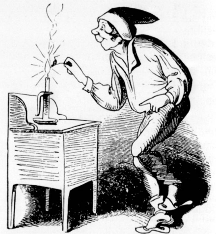
Abb. 3 Flohjagd mit Lampe im 19. Jahrhundert. Zwei Szenen aus Wilhelm Buschs Bildergeschichte »Der Floh oder Die gestörte und wiedergefundene Nachtruhe«. Une chasse aux puces à l'aide d'une lampe au XIXe siècle. Deux scènes tirées de Wilhelm Busch. Caccia alla pulce con lucerna nel XIX secolo. Due scene dalla storia illustrata di Wilhelm Busch.