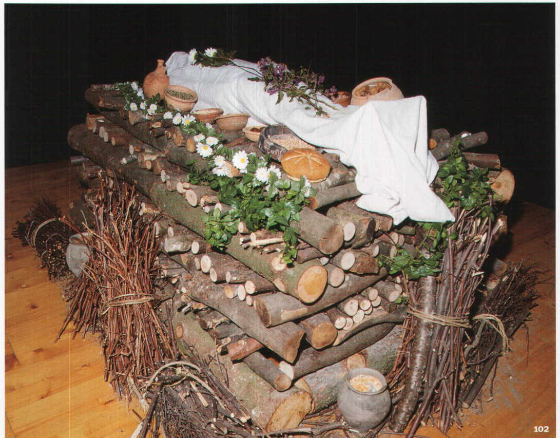
Fig. 102 Reconstitution muséographique d'un bûcher funéraire gallo-romain. Ricostruzione in museo di un rogo funebre gallo-romano.