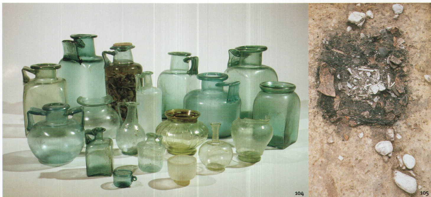
Fig. 105 Tombe à incinération de la nécropole rurale de Faoug VD, à quelques kilo- mètres d'Avenches. Les ossements calcinés (au centre) ont probablement été déposés dans un petit coffret en bois ou dans un contenant en tissu, aujourd'hui disparu.

sépultures sont pratiquement les seuls témoins susceptibles d'éclairer les croyances funéraires des populations gallo-romaines. De fait, il est très délicat de relever parmi ces gestes répétitifs et peu variés ceux qui relèvent d'une véritable conviction collective ou individuelle. Le dépôt d'offrandes alimentaires, de boissons et d'effets personnels (éléments de parure, instruments de toilette) semble en tout cas témoigner d'une croyance en une certaine forme de survie, que ne