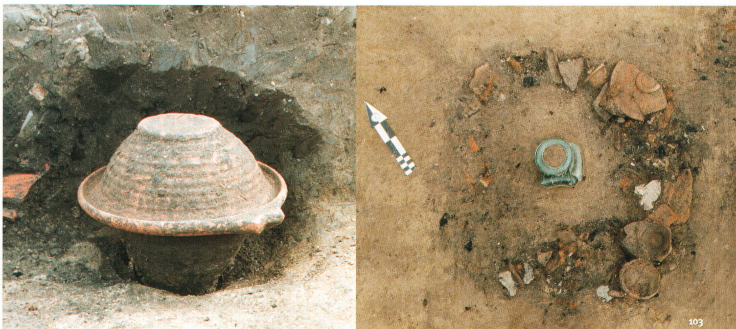
Fig. 103 Deux exemples de sépultures à incinération à urne de la nécropole d'En Chaplix (2 e s. apr. J.-C.).

dans un coffret de bois ou directement dans une fosse (fig. 103 et 105). Une partie des offrandes brûlées, quantitativement très variable, est également déposée dans la tombe. Parfois, des offrandes supplémentaires sont placées intactes dans la fosse ou dans l'urne. Durant cette période, l'inhumation est également pratiquée, surtout pour les nourrissons et les très jeunes enfants (fig. 106), comme l'attestent un texte souvent cité de Pline l'Ancien « l'usage général veut