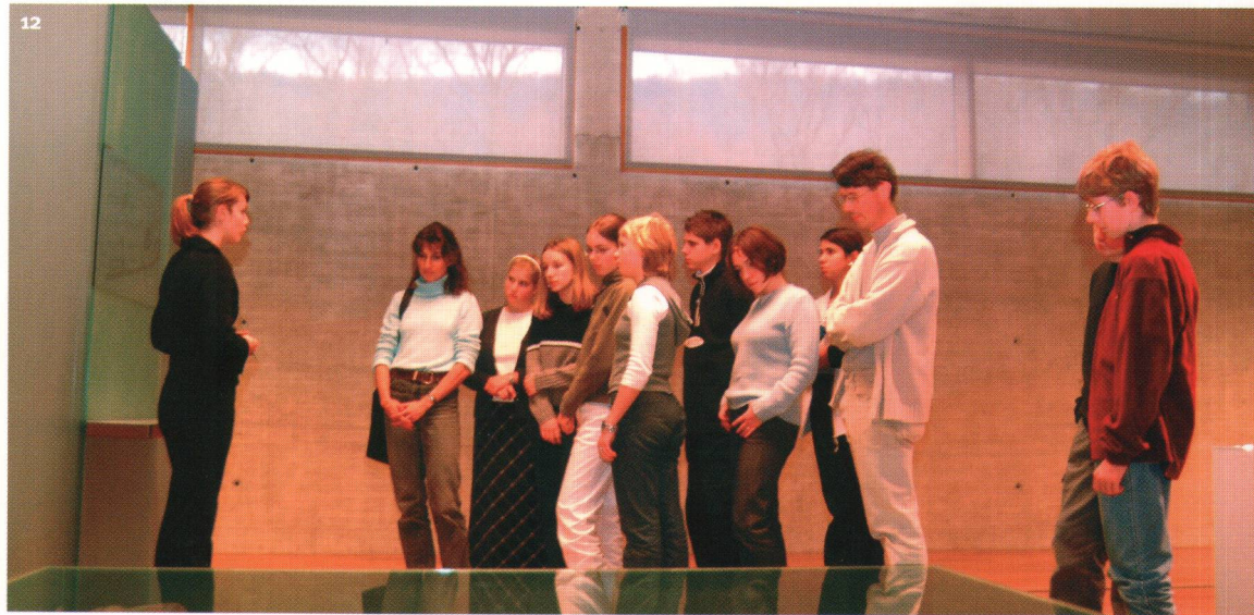
Fig. 12 Visite guidée dans les salles d'exposition.