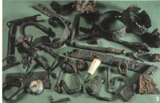
Obersiggenthal-Kirchdorf, Brühl 1997. I reperti di metallo e il punteruolo con impugnatura d'osso a restauro ultimato. Si tratta perlopiù d'elementi di carro e borchie di vario tipo. Un unico reperto, una falera, è di bronzo.