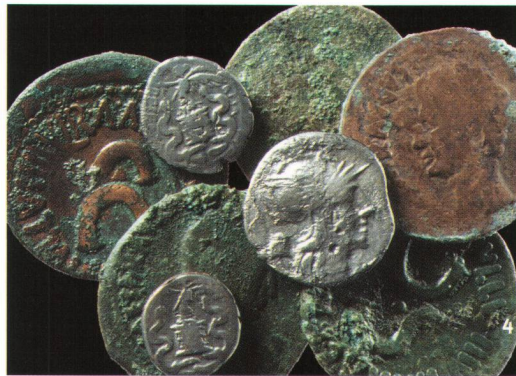
Baden-Römerstrasse 10/12 (2004). Le monete contenute nel piccolo borsellino, a restauro ultimato.