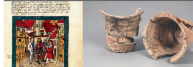
Kunstgeschichte und Archäologie im Kanton Zug | 6.1