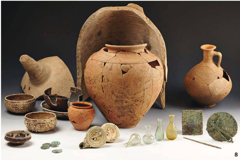
Abb. 8 Funde aus dem jüngeren Brandgrab innerhalb des Rundbaus. Das Grab der Maximila?

Les objets découverts dans l'incinération la plus récente à l'intérieur de l'édifice circulaire; celle de Maximila?