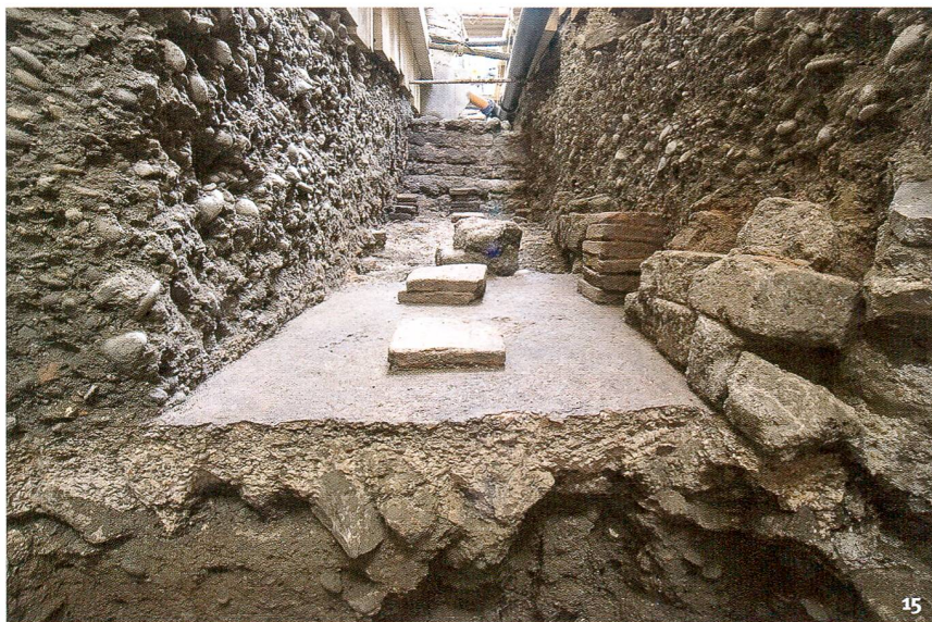
Fig. 15 Coupe à travers l'hypocauste d'une confortable maison en pierre d'époque romaine tardive, vue vers le nord.

Sguardo da nord sui pilastrini dell'ipocausto di un edificio in muratura ben equipaggiato di epoca tardo-romana.