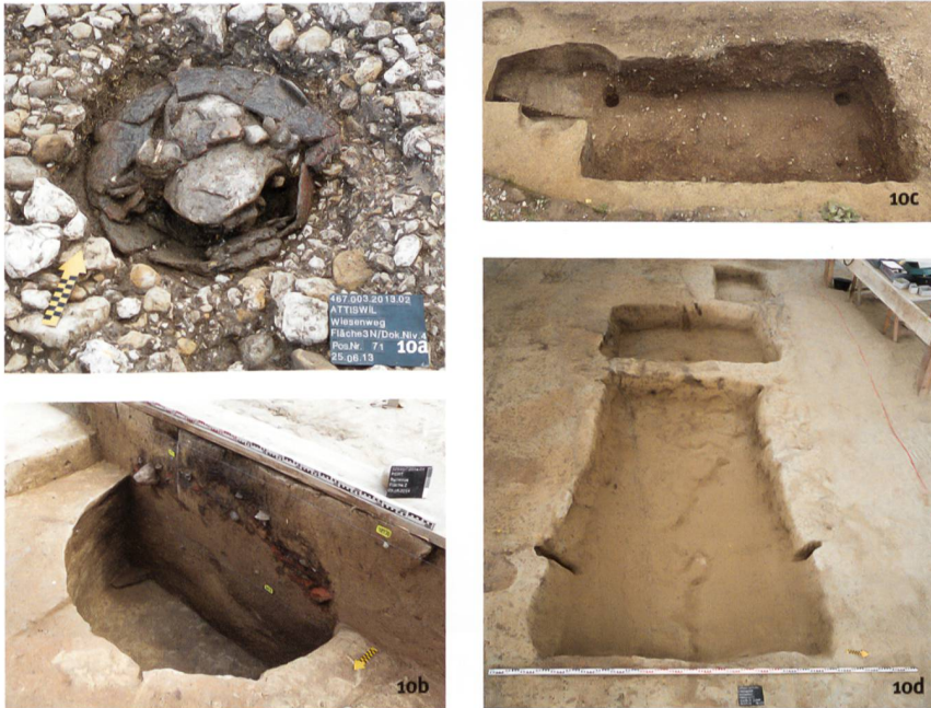
Abb. 10 Beispiele für die feucht-kühle Lagerhaltung in ländlichen Siedlungen. a) Attiswil, Wiesenweg 15/17. Vollständiges Vorratsgefäss aus der Bronzezeit. b) Port, Bellevue. Latènezeitliche Grube zur Lagerung von Getreide. c) Biel, Gurzele. Holzverschalter Erdkeller des Hochmittelalters. d) Kirchdorf, Winkelmatte. Spätneuzeitliche Erdmieten.

Esempi di sistemi di conservazione in ambiente umido e fresco degli insediamenti rurali. a) Attiswil, Wiesenweg 15/17. Recipiente per provviste dell'età del Bronzo. b) Port, Bellevue. Fossa dell'epoca di La Tène per lo stoccaggio di cereali. c) Biel, Gurzele. Cantina interrata rivestita di legno. d) Kirchdorf, Winkelmatte. Fossa di stoccaggio moderna.