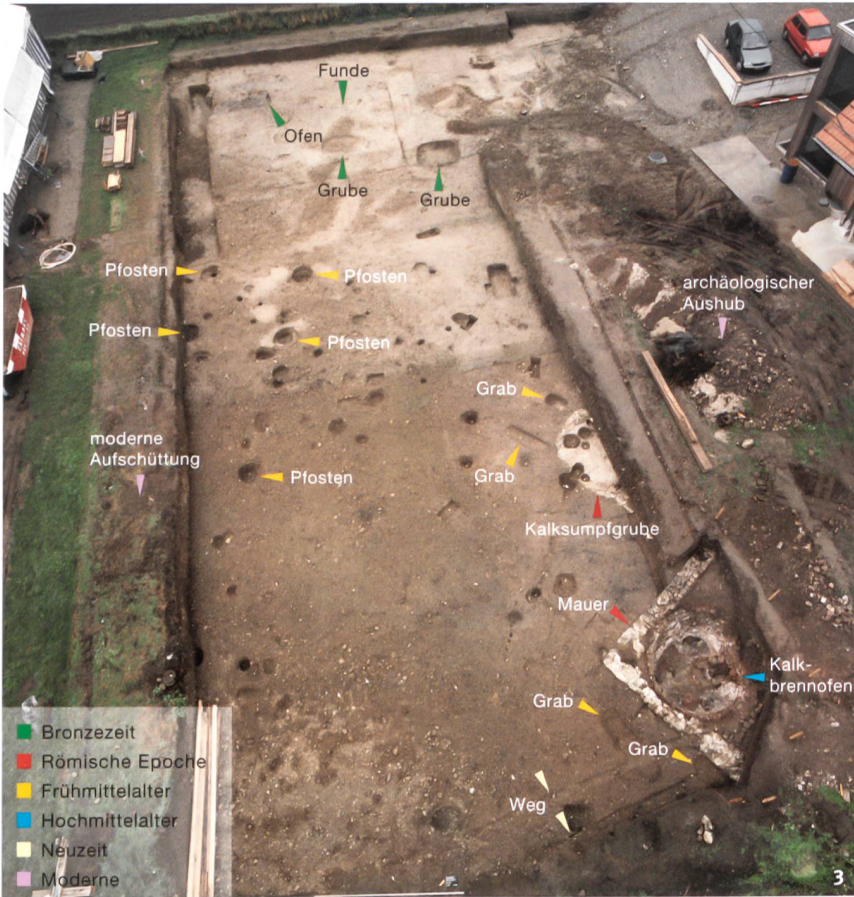
Abb. 3 Köniz, Niederwangen Stegenweg 3-5. Archäologische Befunde verschiedener Epochen charakterisieren die Fundstelle.

Köniz, Niederwangen Stegenweg 3-5. Il sito è caratterizzato dalla presenza di contesti archeologici di epoche distinte.