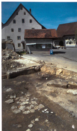
Abb. 4 Wölflinswil, 2002. Mittelalterliche Baubefunde unter ehemaligen Bauernhäusern am Dorfplatz. Fundmeldung durch Patrick Bircher.

Wölflinswil, 2002. Vestiges d'un bâtiment médiéval sous une ancienne ferme, au centre du village. Découverte signalée par Patrick Bircher.