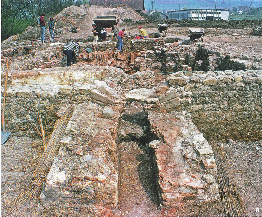
Abb. 8 Die römischen Thermen bei Schleithem. Ausgrabungsfoto von 1975.

Les thermes romains près de Schleithem. Vue des fouilles de 1975.