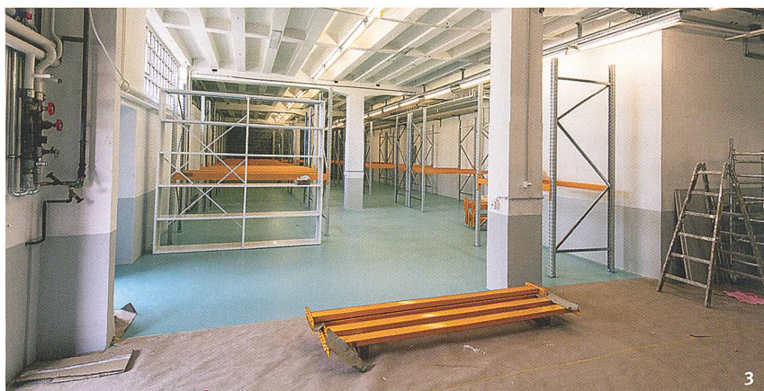
Fig. 3 Le nouveau dépôt permet de stocker du matériel selon les normes en vigueur, de déployer des activités de recherche et d'accueillir ponctuellement du public.

Das neue Depot erlaubt es, die Materialien vorschriftsgemäss zu lagern, Forschungsarbeiten durchzuführen und auch die Öffentlichkeit gelegentlich zu empfangen.