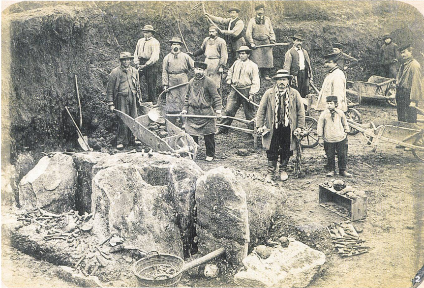
Fig. 2 Dolmen mis au jour en 1876 en cours de fouille.

Dolmen portato alla luce nel 1876 in corso di scavo.