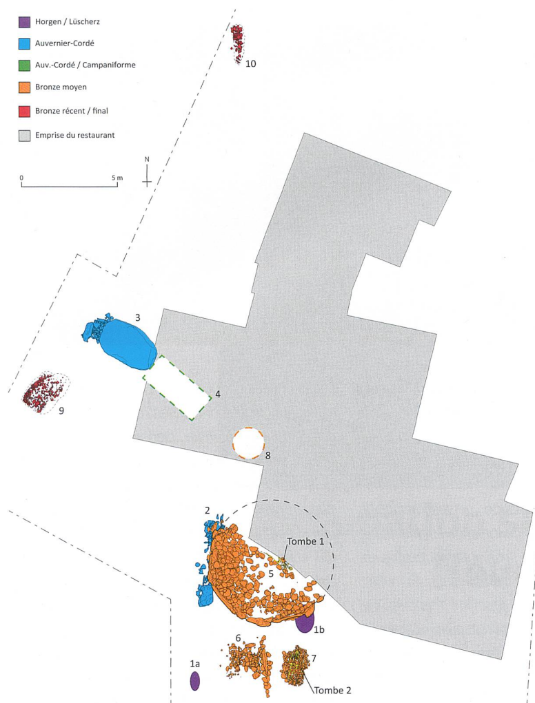
Fig. 5 Plan général des structures archéologiques par phases chronologiques. 1a-b foyers du Néolithique final; 2 alignement mégalithique; 3 menhir couché; 4 dolmen; 5 tumulus (tombe 1 au centre); 6 tombe à incinération; 7 tombe à inhumation (tombe 2); 8 tombe à inhumation de 1876 (emplacement supposé); 9-10 fosses-foyers.

Pianta generale delle strutture archeologiche ordinate per fasi cronologiche. 1a-b Focolari del Neolitico finale, 2 allineamento megalitico; 3 menhir steso; 4 dolmen; 5 tumulo (tomba 1 al centro); 6 tomba a incinerazione; 7 tomba a inumazione (tomba 2); 8 tomba a inumazione del 1876 (localizzazione presunta); 9-10 fosse-focolari.