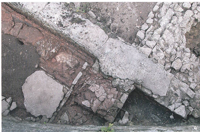
Fig. 4 Vestiges du premier état. A gauche, restes de l'hypocauste transformé ensuite en bassin; au centre le praefurnium bouché; dans l'angle supérieur droit l'épais radier d'une des salles pavées; en haut le frigidarium dont le sol n'a pas été conservé.

Vestigia della prima fase. A sinistra i resti dell'ipocausto trasformato successivamente in vasca al centro il praefurnium chiuso; nell'angolo superiore destro la platea di grande spessore di una delle sale pavimentate; in alto il frigidarium, di cui non si è conservato il pavimento.