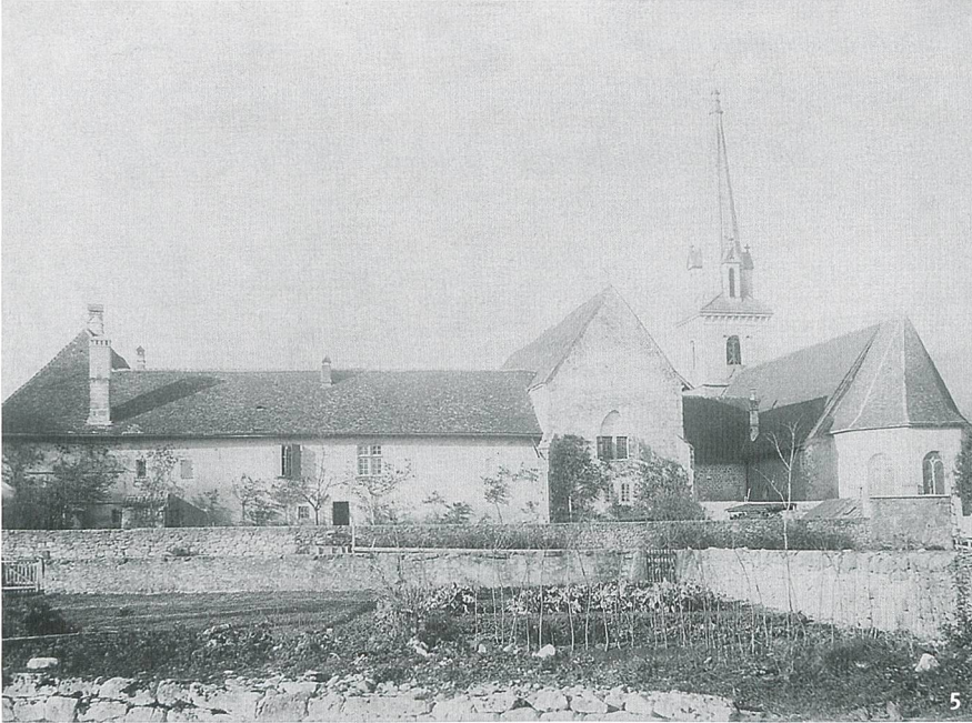
Fig. 5 Les chœurs gothiques des églises Saint-Pierre (à gauche) et Notre- Dame (à droite); celui de Notre-Dame a été remanié au 17 e siècle.

I cori gotici delle chiese di Saint- Pierre (a sinistra) e di Notre-Dame; quello di Notre-Dame (a destra) è stato rimaneggiato nel XVII secolo.