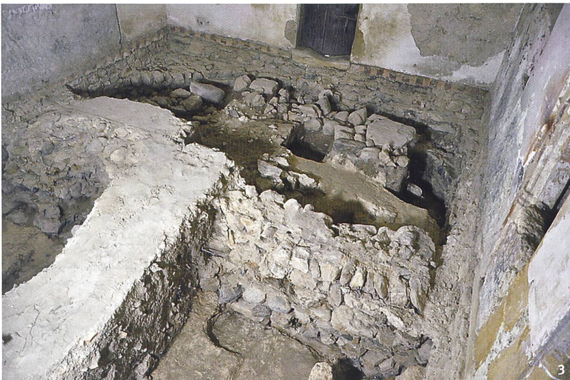
Fig. 3 Le chœur durant les fouilles. Il coro in fase di scavo.

du terrain, transformant la cure en une résidence néo-gothique, tandis que l'église désaffectée sert dorénavant de remise et que le cimetière l'entourant est transformé en jardin. Un siècle et demi plus tard, la propriété est toujours entre les mains des descendants de Léo Jeanjaquet, la famille Walder. Celle-ci a conduit ces dernières années d'importants travaux de restauration des bâtiments et autorisé la tenue d'une fouille-école, menée chaque été de 2013 à 2016 avec des étudiants des universités de Neuchâtel et de Lausanne.