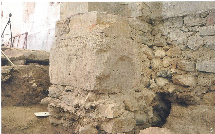
Fig. 5 Autel antique en emploi dans les fondations du chœur gothique. Altare antico reimpiegato nelle fondamenta del coro gotico.

église, bordé par le ruisseau du Mortruz au sud et la route de Frochaux au nord. Il apparaît donc plausible d'imaginer que l'édifice dont proviennent les blocs architecturaux gallo-romains du Crêt de-la-Cure était situé à proximité immédiate du lieu de culte. Seuls des prospections géophysiques ou des sondages permettront néanmoins de s'assurer que ce monument occupait bien la «grande place» signalée par A. Parent.