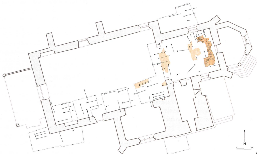
Fig. 6 Localisation des sépultures du Haut Moyen Age, avec les vestiges du sol et des maçonneries des premiers états de l'église. Localizzazione delle sepolture di epoca altomedievale, con le vestigia del pavimento e le mura della prima fase della chiesa.

La nécropole est organisée par rangées successives de tombes se développant autour d'un dense noyau de tombeaux situés à l'emplacement du chœur actuel, le point culminant de la colline. On observe les traces de réouvertures et de réutilisations de certaines tombes, ce qui témoigne de la longévité de leur emplacement. Ces réouvertures, de même que le creusement de nouvelles