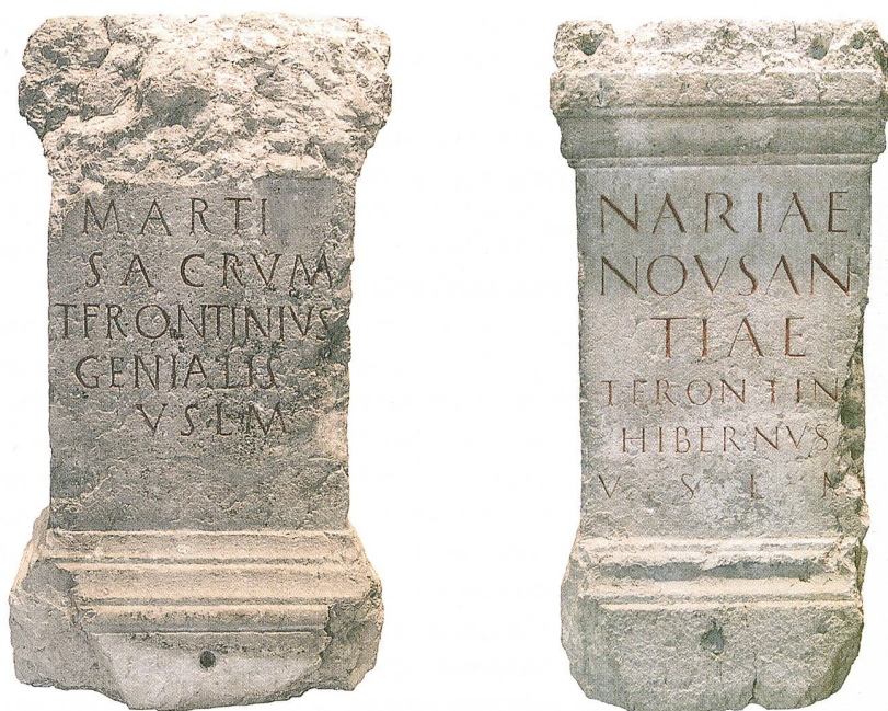
Fig. 4 Autels dédiés à Mars et à Naria Nousantia. L'altare dedicato a Marte e a Naria Nousantia.

Aucune trace des fondations d'un bâtiment gallo-romain n'a été retrouvée à l'emplacement de l'église. Des fragments de tuiles plates ( tegulae ) et de placages de calcaire et de marbre blanc ayant toutefois été mis au jour dans son sous-sol, on suppose qu'une occupation antique se trouvait à proximité. Mais surtout, en 1807, le sculpteur Aubert Parent signale dans ses Recherches sur les antiquités de la Principauté de Neuchâtel en Suisse qu'«En face de l'église paroissiale, au-dessus d'un ruisseau qui forme une cascade pittoresque se voit une grande place couverte de sapins. [...] Les matériaux déterrés dans cet endroit font soupçonner qu'il fut l'emplacement d'un grand édifice.» Ce terrain plat est aujourd'hui encore bien reconnaissable à l'ouest de l'ancienne