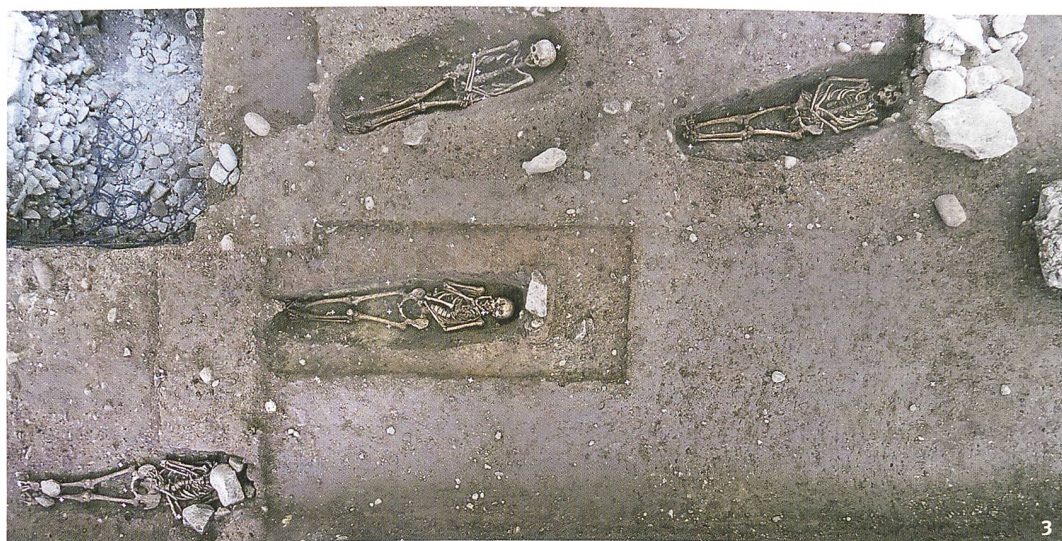
Fig. 3 Tombe de la nécropole du 10 e siècle.

Le site est occupé dès l'époque protohistorique, comme l'indiquent des tessons de céramique, peut-être à associer à quelques trous de poteau. Une occupation aux alentours est ensuite attestée à l'époque mérovingienne par la découverte, en 1915, à environ 150 m au nord-ouest de