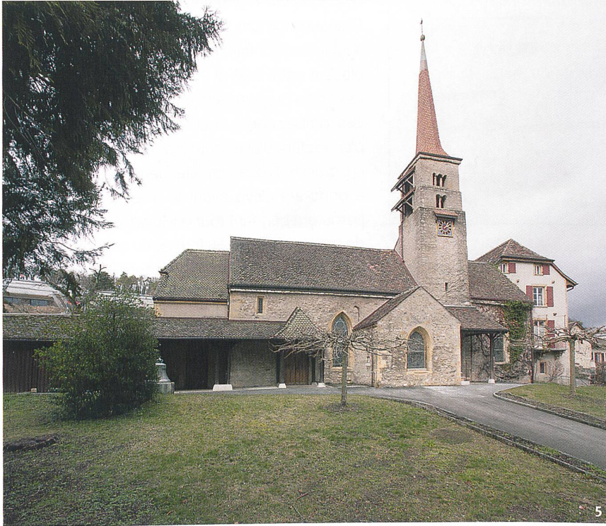
Fig. 5 L'église et son clocher roman.