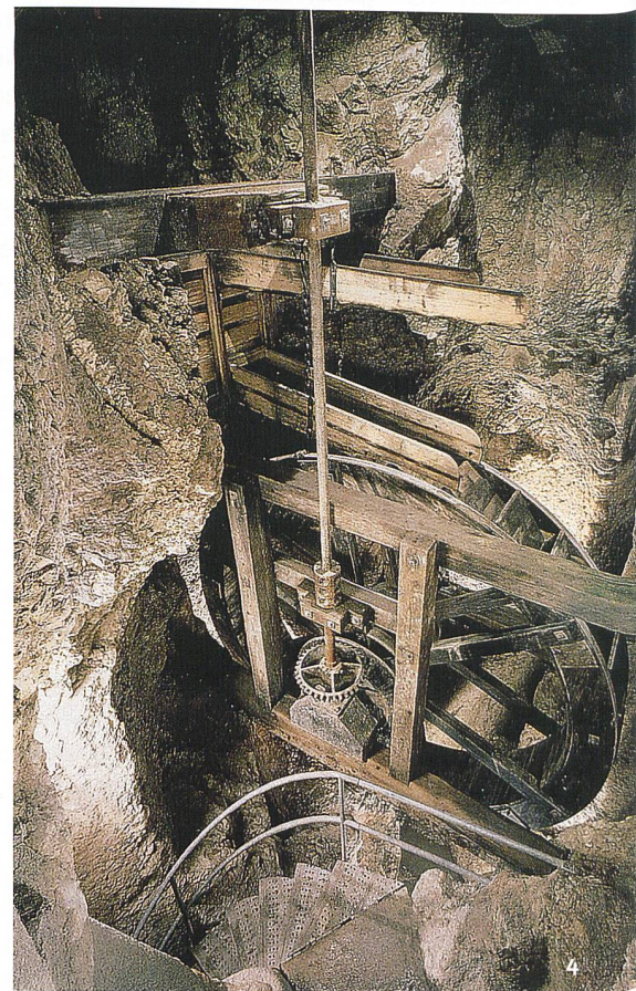
Fig. 4 Roue à augets installée à l'intérieur de la grotte, dans le puits n°2, depuis 1984.

Son sol était constitué à l'ouest d'un grossier pavage et, à l'est, de terre battue recouverte d'une épaisse couche de sciure. Au centre ont été dégagées deux fosses maçonnées rectangulaires de 2 m par 0,7 m de côté, profondes de 0,7 m et reliées entre elles par un solide massif maçonné (fig. 2, n° 12). Les surfaces apprêtées des blocs d'encadrement et les restes de fixations métalliques attestent que ces aménagements