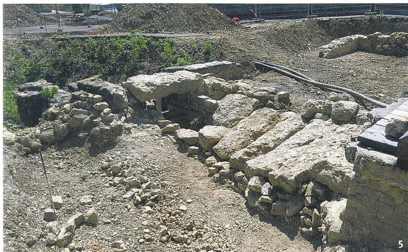
Fig. 5 Vue des maçonneries dégagées au pied de la façade. Au premier plan, les vestiges extérieurs de la galerie ayant remplacé l'exutoire primitif. En arrière-plan, les murs de la digue primitive.

Veduta dell'opera muraria portata alla luce ai piedi della facciata. In primo piano, le vestigia esterne della galleria che ha rimpiazzato il canale. Sullo sfondo le mura della diga originaria.