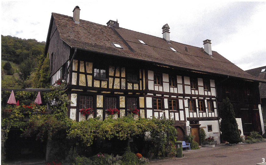
Fig. 3 Sous l'égide de la chaire d'Archéologie médiévale, une nouvelle édition du volume les Monuments d'art et d'histoire du district de Dielsdorf est actuellement en préparation, ouvrage dans lequel figurera ce bâtiment orné d'une œuvre du «peintre du cirque» Eugène Fauquex, à Weiach.

Presso la cattedra Archeologia medievale è in preparazione la nuova edizione del volume «I Monumenti d'arte e di storia» del distretto di Dielsdorf, dove figurerà questa casa con le facciate dipinte dal «pittore circense» Eugène Fauquex a Weiach.