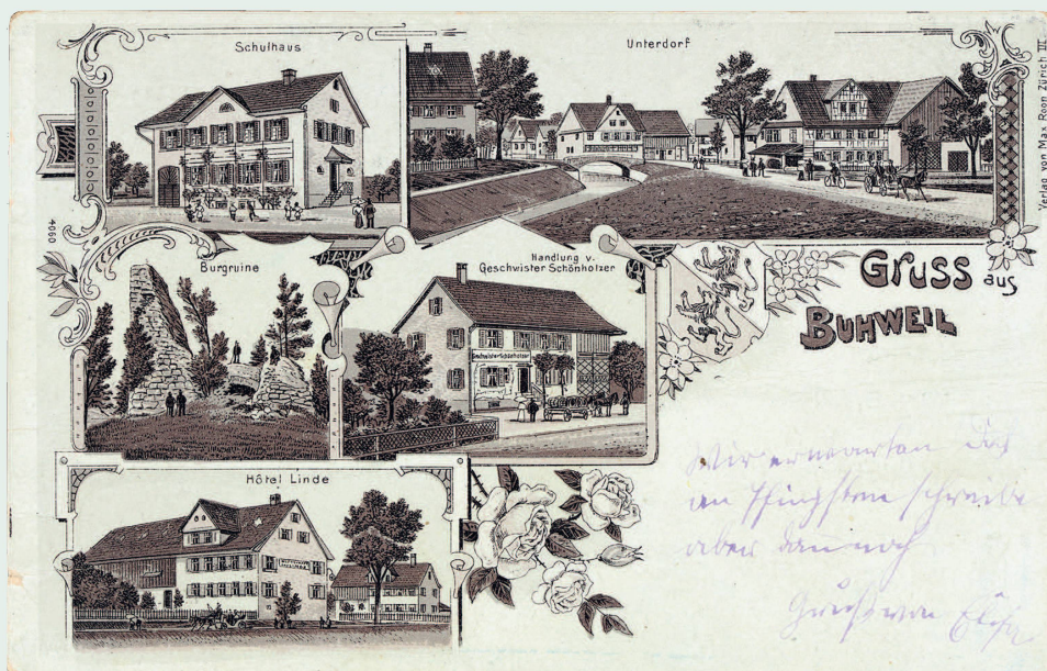
Postkarte von Buhwil, Fotolithografie um 1900. Die Ruine gehörte schon damals zu den Sehenswürdigkeiten des Dorfes.

Mag sein, dass Burgruinen speziell dafür prädestiniert sind, aber der «Denkmalschutz von unten», also von der Bevölkerung vor Ort erwünscht, finanziell und personell