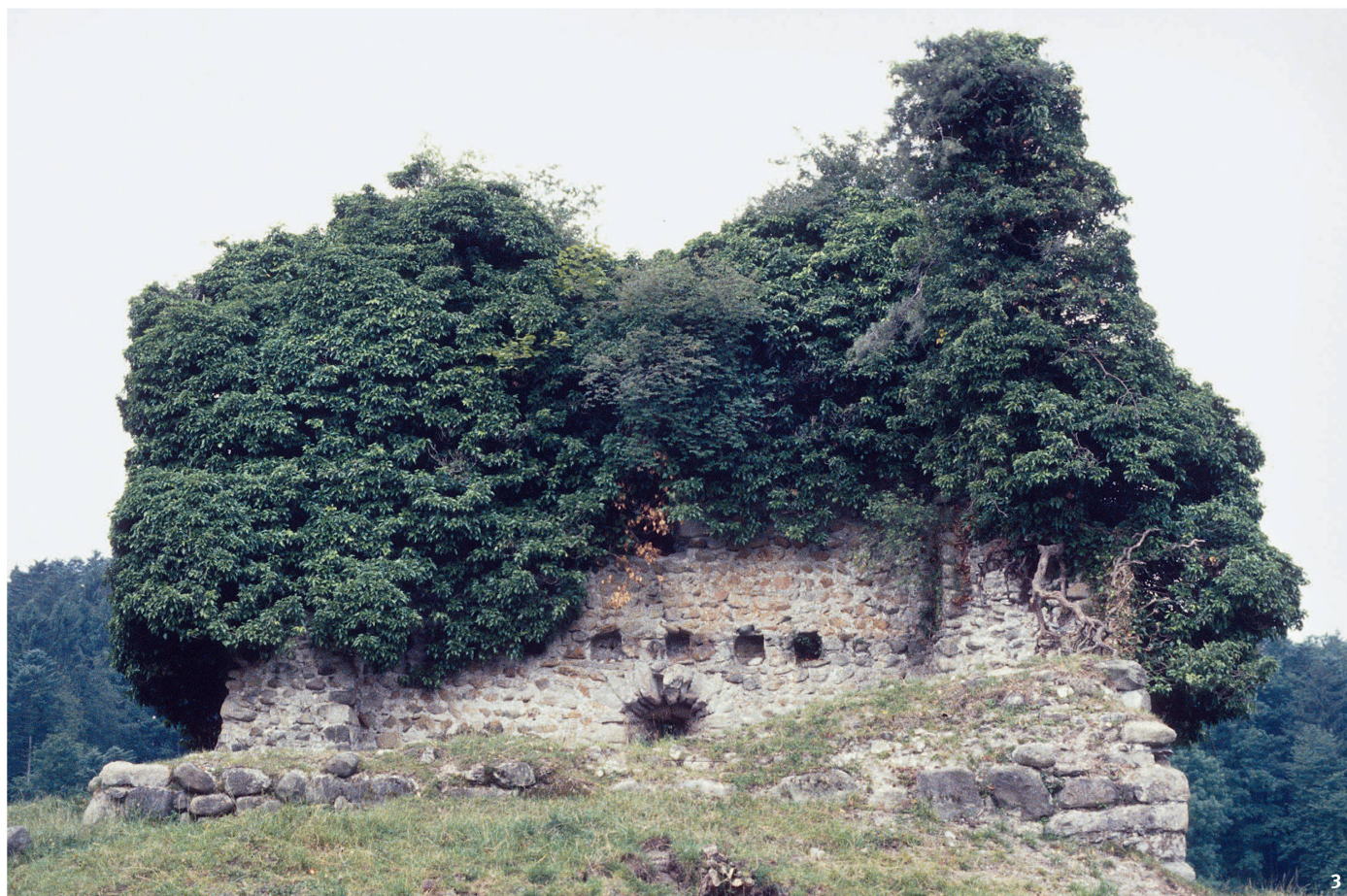
Abb. 3 Ruine Anwil mit Efeubewuchs vor der ersten Sanierung 1982.

Les ruines d'Anwil sous leur manteau de lierre avant les premiers travaux de rénovation en 1982.