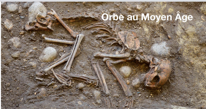
Orbe au Moyen Âge