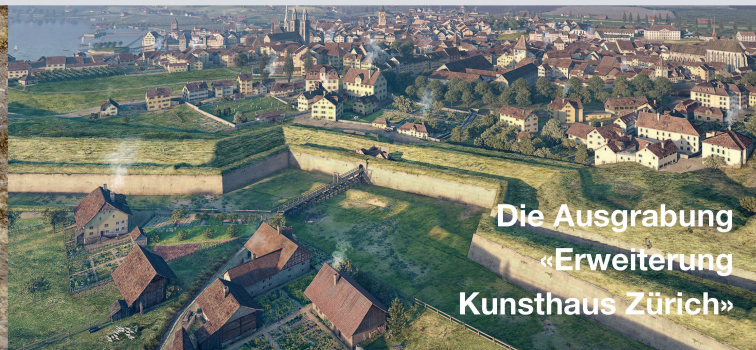
Die Ausgrabung «Erweiterung Kunsthhaus Zürich»