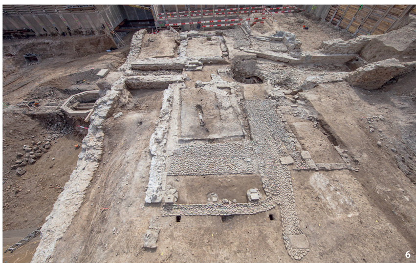
Abb. 6 Die Reste der beiden Wachhäuschen und ihrer Umgebung beim Hottingerpörtl.

Vestiges des deux postes de garde et des aménagements environnants près de la Hottingerpörtl.