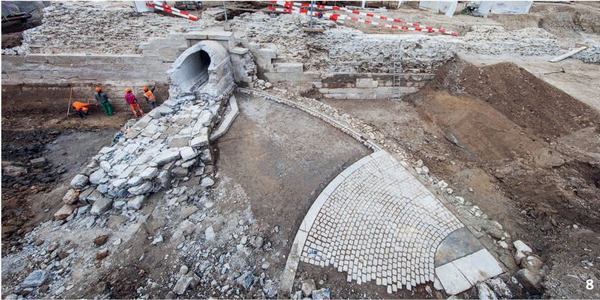
Abb. 8 Das ovale Wolfbachbassin vor der Eskarpenmauer bei der Freilegung.

Le bassin ovale du Wolfbach en cours de fouille, juste devant le mur d'escarpe.