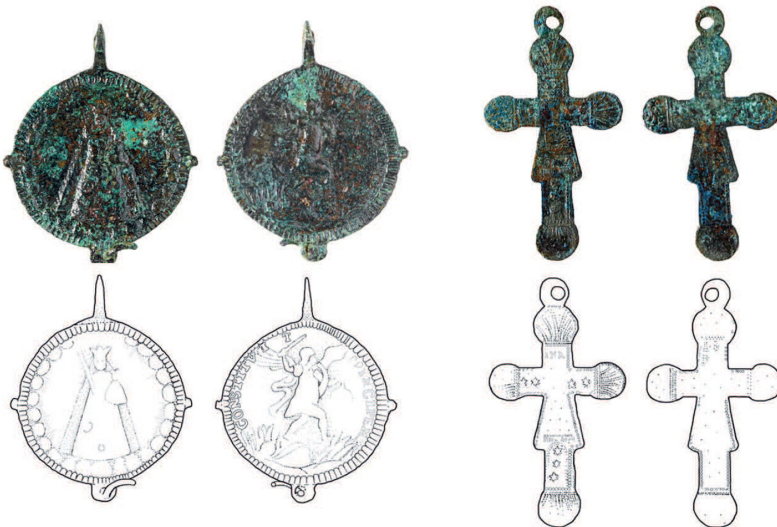
Abb. 4 Neuzeitliche Religiosa aus den Gräbern als Spiegel der Frömmigkeit zeigen auch den Interaktionsradius der Menschen von Einsiedeln (SZ) bis Mariazell (A).

Les objets à caractère religieux issus des tombes reflètent la piété, mais aussi le rayon d'interactions des personnes inhumées, de Einsiedeln (SZ) à Mariazell (A).