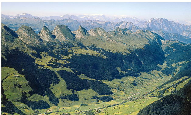
1 Churfirstenkette mit dem Selun, bei dem sich auch die paläolithische Fundstelle «Wildmannlisloch» befindet (Bildmitte), im Tal Alt St. Johann im Obertoggenburg (SG).