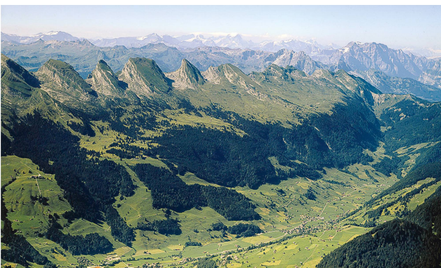
1 Churfirftenkette mit dem Selun, bei dem sich auch die paläolithische Fundstelle «Wildmannlisloch» befindet (Bildmitte), im Tal Alt St. Johann im Obertoggenburg (SG).

Keine 30 Jahre später wird Johannes Seluner 1926 vom Totengräber aus der Erde geholt und zum Forschungsobjekt. Die Initiative für diese Exhumierung geht u.a. von Emil Bächler aus, der damals in den drei Höhlen Wildkirchli, Drachenloch und Wildenmannlisloch am Selun den alpinpaläolithischen Bärenjägern nachsteigt und spekuliert, dass das Wildenmannlisloch auch vom Seluner bewohnt war: «Das Erbgedächtnis des Menschen mochte ihm diese Schutzstätte als etwas Dunkelbekanntes aus der einstigen Höhlenbesiedlung des Menschen sympathisch gestaltet haben.» Die Gebeine des ausgegrabenen Seluner werden am Anthropologischen Institut der Universität Zürich von Otto Schläglhaufen auf Merkmale prähistorischer Menschenrassen