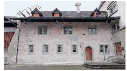
2 Die Nordfassade der Halle mit Backstein- und Tuff-Sichtmauerwerk von 1200. Alle heutigen Fenster und die Tür sind nachträglich eingebaut worden.