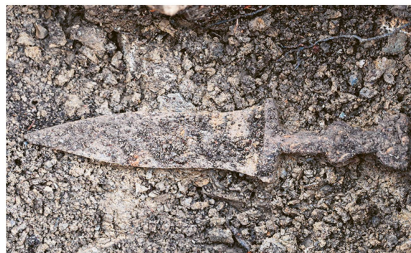
1 Oberhalbstein, römischer Dolch in Fundlage, Januar 2023.