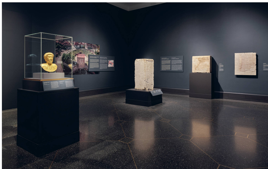
1 L'exposition The Gold Emperor from Aventicum à la Villa Getty, Malibu (USA). Die Ausstellung The Gold Emperor from Aventicum in der Villa Getty, Malibu (USA). L'esposizione The Gold Emperor from Aventicum alla Villa Getty, Malibu (USA).

Getty Villa Museum 17985 Pacific Coast Highway Pacific Palisades CA 90272, USA getty.edu/art/exhibitions/aurelius/