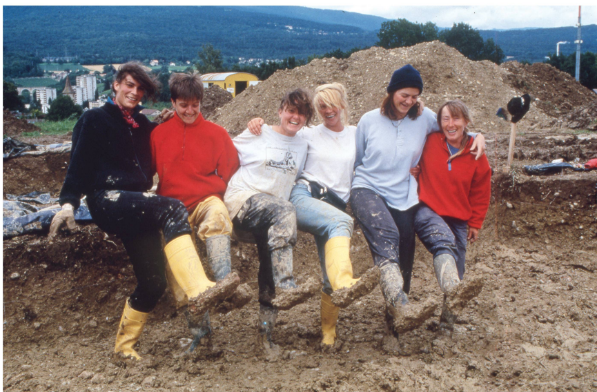
1 Cortailod (NE), 1997.

Ces images d'ambiance dévoilent l'envers du décor des fouilles archéologiques et illustrent l'engagement physique et moral des archéologues sur le terrain. Dans leur spontanéité, elles témoignent des charmes et des contraintes de la vie de chantier, de l'enivrement de la camaraderie partagée, mais aussi les moments de solitude dans ces espaces encore anonymes où s'élèveront bientôt les infrastructures du futur. On y perçoit la longueur des journées de travail, dans la chaleur écrasante des campagnes estivales ou face aux morsures du froid et de l'humidité, dans ce corps à corps constant avec la terre qui nourrit notre savoir sur le passé.