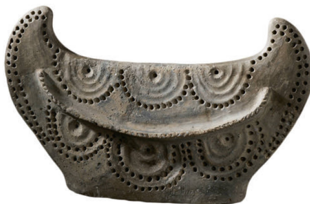
Mondhorn von Hauterive (NE): Derzeit zu sehen im Museum Schloss Burgdorf.

3 mai 2023, 20h15, Neuchâtel, aula de l'Université du 1 er mars Conférence: Campement méso- lithique, villages néolithiques, champs romains – Le site de Naters VS-Breite, par Samuel van Willigen Infos: ArchéoNE, Association des amis du Laténium et de l'archéologie neuchâteloise unine.ch