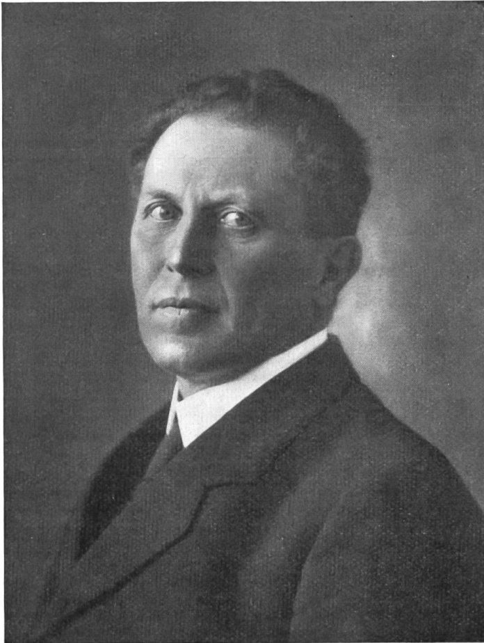
Dr. ing. h. c. W. Boveri, † 28. Oktober 1924.

gesellschaft Baden. — Boveri war der gegebene Mann, um dem jungen Unternehmen die Unterlagen für die Beschäftigung zuzuführen. Durch sein er bestimmtes, ruhiges Auftreten und durch eine klare Sprache wusste er das Vertrauen der Interessenten für die damals vollständig neuen technischen und wirtschaftlichen Probleme zu erwerben. Die technischen Erfolge und die Idee der vermehrten Ausnützung der Wasserkräfte