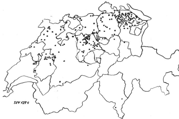
Fig. 2. Karte der durch Selbstentzündung verursachten Uebergärungen und Bränden von Heustöcken in der Schweiz im Jahre 1925.

Es ist auffallend, dass dem künstlichen Grastrocknen noch nicht mehr Aufmerksamkeit geschenkt wurde. Namentlich sollten die Brandversicherungsanstalten diese Technik vielleicht subventionieren; denn es ist ausgeschlossen, dass ein Heustock mit künstlich getrockneter Ware zur Selbstentzündung gerät.