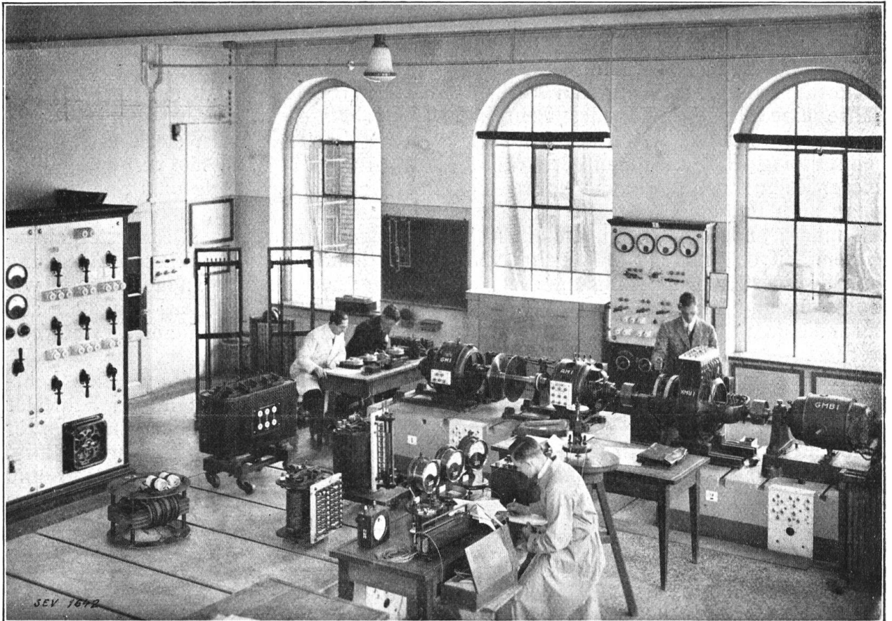
Fig. 1. Blick in einen Maschinensaal der heutigen elektrotechnischen Laboratorien der E. T. H.