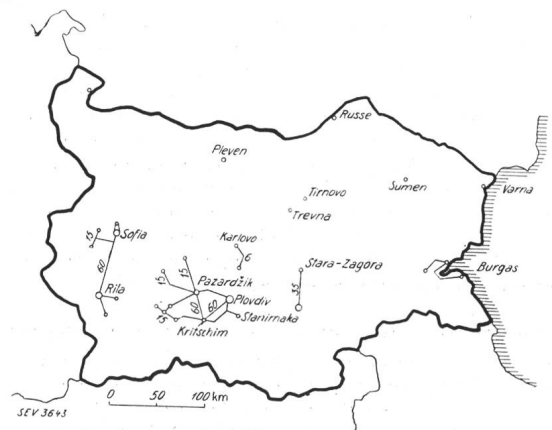
Fig. 1. Plan der Hochspannungsleitungen Bulgariens. (Die Zahlen bei den Leitungen bedeuten die Spannung in kV.)

Der Beginn der Entwicklung der bulgarischen Elektrizitätswirtschaft reicht bis in das Jahr 1901 zurück, als in Pancrevo ein hydroelektrisches Kraftwerk für die Elektrizitäts-A.-G. Sofia erstellt wurde. Im Jahre 1912 folgte die Erstellung eines Dieselmotorkraftwerkes in Kisanlik und kurz darauf die