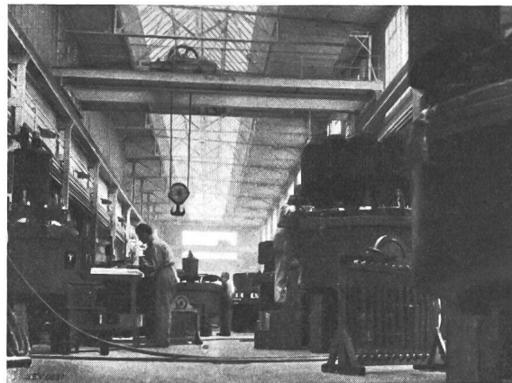
Fig. 2. Mutatorenbau.

einen Doppelschnelltriebwagen der SBB von 820 kW Stundenleistung für eine maximale Geschwindigkeit von 150 km/h mit Drehkerntransformator für stufenlose Geschwindigkeitsregulierung, ferner einen Akkumulatoren-Lastwagen , einen Elektrokarran und eine vollständige Trolleybusausrüstung mit Schützensteuerung, die stossfreies Anfahren und Bremsen durch Verwendung von 10 Widerstandsstufen, einer Stufe bei Vollfeld plus 10 Feldschwächestufen ergibt. Viel beachtet