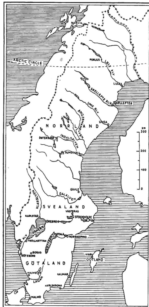
Fig. 1 Karte Schwedens mit den Wasserläufen und wichtigsten Ortschaften

schaffen. Ferner war es möglich, durch Regulierung der Suorva- und Lulejaure-Seen in Norrland die