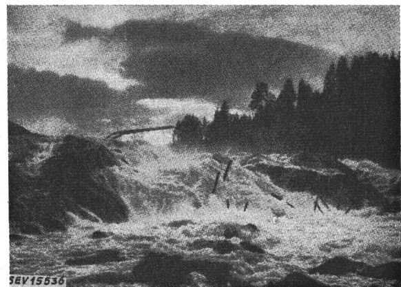
Fig. 2 Typische schwedische Gefällstufe

Die Staatliche Kraftwerkverwaltung ist mit rund 4,8 TWh zu einem Drittel an der gesamten Energieerzeugung des Landes beteiligt. Sie verfügt über