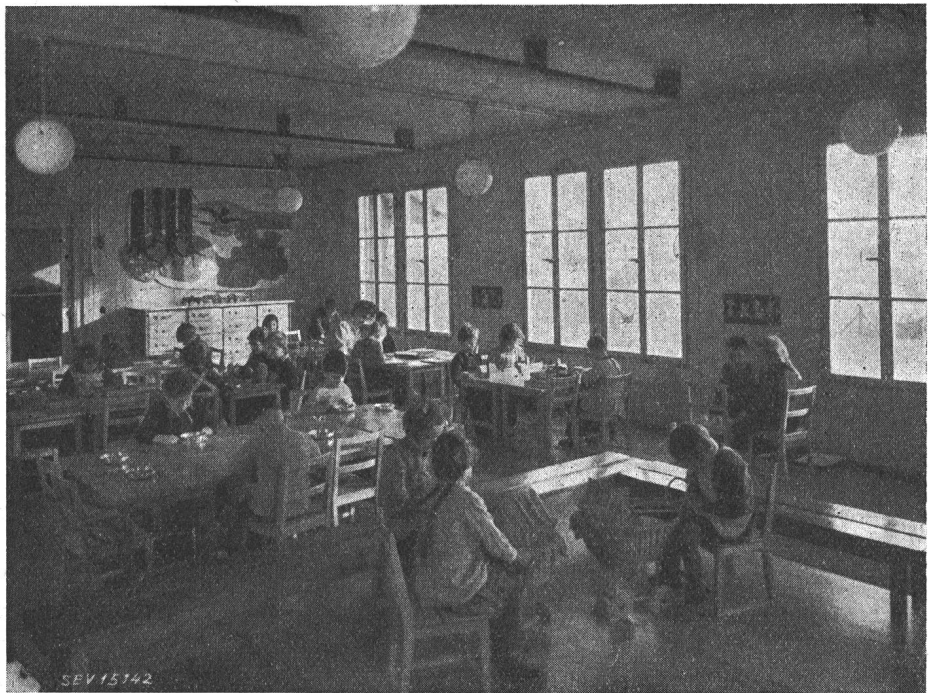
Fig. 1 Schulstube des Kindergartens in Riehen (BS) An der Decke sichtbar drei der insgesamt vier Strahlungsheizkörper

Anschlusswert. In diesem Falle beträgt die Heizleistung 1,25 kW, entsprechend einem spezifischen Wert von 43 W/m 3 .