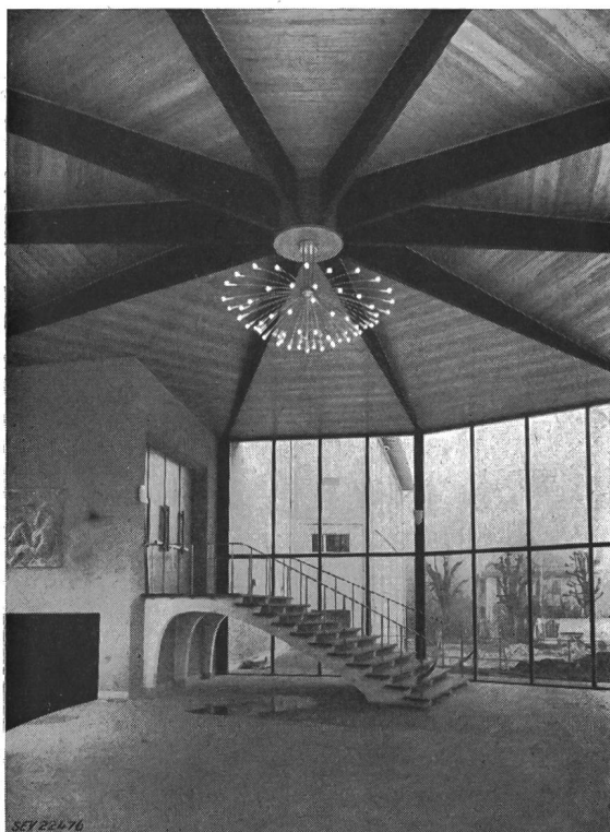
Fig. 2 Kurtheater erbaut 1952/53

Plastiken unauffällig ins Licht gerückt und gleichzeitig deren Wirkung und Betrachtung durch keine Fremdkörper gestört werden. Ein anschaulich gearbeitetes Modell lässt die etwas heikle Frage soweit entscheiden: Lichtquellen in die Zimmerdecken einzubauen, deren Öffnungen durch Gläser abgedeckt werden, die optisch so bearbeitet sind, dass die Lichtstrahlen durch Brechung bevorzugt an die Wände geworfen werden. Dieser Entscheid war aus baulichen Gründen frühzeitig zu fällen. Das Resultat hat die Zweckmässigkeit dieses Vorgehens bestätigt, wobei hinzuzufügen ist, dass heikle Aufgaben wie diese von der Nachprüfung der Modellversuche durch Proben am Bau selbst nicht entheben.