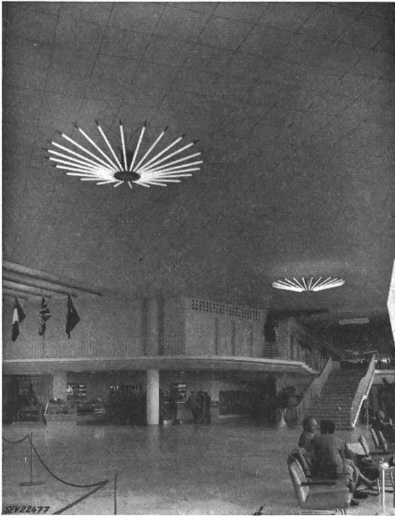
Fig. 3 Grosse Halle des Flughafens Kloten erbaut 1952/53

Entwerfer hinsichtlich der Wahl des Materials und in der Formung einigermassen gebunden; immerhin hat er die Aufgabe so anzupacken, dass er aus seiner Kenntnis der Materie heraus den Architekten auf mögliche Baustoffe aufmerksam macht, die diesem vielleicht nicht bekannt sein können, und aus seiner eigenen Betrachtungsweise Form und Gestalt zu suchen, um diese schliesslich in freier Aussprache