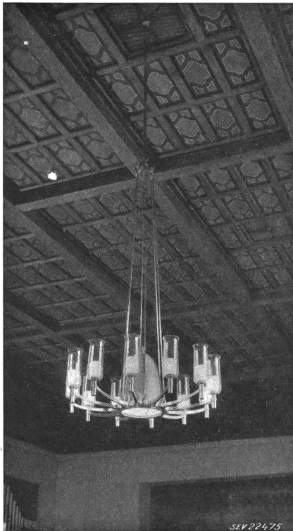
Fig. 1 Kirche

Vorerst ist klarzustellen, dass der Entwerfer und Gestalter der Leuchte dort beginnt, wo der eigentliche Lichttechniker, wie er heute an anderer Stelle vorgestellt wurde, seine Arbeit vorläufig abschliesst; dies sofern es sich nicht, wenn man sich so ausdrücken darf, um eine «Personalunion» handelt. Das will heissen, dass bei einer Beleuchtungsanlage