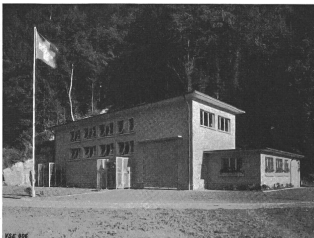
Fig. 1 La centrale d'Alpnach de la société «Kraftwerk Sarner Aa A.-G.»

La salle des machines comprend deux groupes générateurs à axe vertical. Dans la même salle se trouvent d'un côté les armoires de commande pour l'usine et le barrage, de l'autre les cellules de couplage, qui sont du type sous armoire. Deux transformateurs de 1650 kVA et 5,2/12 kV sont placés en plein air devant l'usine. La canalisation à 12 kV qui relie l'usine au réseau des CKW traverse l'aérodrome voisin en câbles souterrains puis rejoint Horw en longeant les pentes du Pilate.