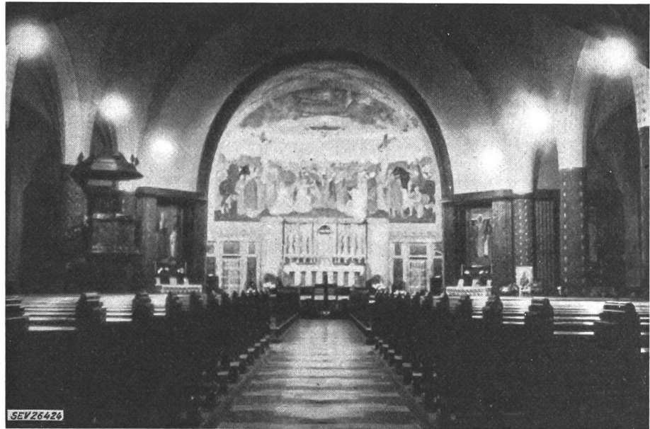
Fig. 6 St.-Pauls-Kirche

Im Jahre 1956 wurde eine neue Beleuchtungsanlage projektiert und erstellt. Sie hatte die Aufgabe, die Gesamtbeleuchtung zu verbessern. Bei der Wahl einer raum- und zweckgerechten Beleuchtungsart wies die wichtige Architektur in Richtung grossflächiger Leuchten (Fig. 6). Gewählt wurden Pendelleuchten von 53 cm Durchmesser. Infolge Verzögerung in der Lieferung von Muranoglasschalen wurden temporär solche aus Opalglas eingesetzt. Mit dieser Anordnung wurde ein massiges Lichtniveau erreicht. Die Beleuchtungsstärke beträgt im Mittel bei voller Beleuchtung 40 lx. Die Gleichmässigkeit der Lichtverteilung ist gut.