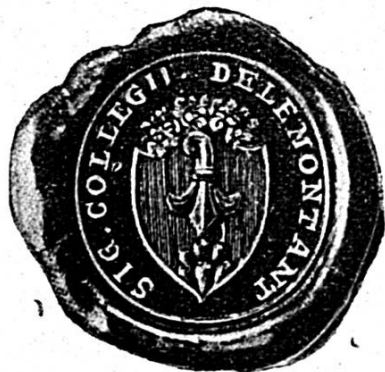
Le cachet de l'ancien Collège

but, il les fit inspecter par une délégation nommée ad hoc . Qui étaient ces délégués et d'où venaient-ils ? Nous l'ignorons ; et pourtant il nous importerait d'autant plus de le savoir que le jugement qu'ils portent sur le collège de Delémont est extrêmement défavorable. Ni l'enseignement, ni les maîtres n'ont le don de leur plaire. Ils expriment la conviction que „dans son état actuel, le collège ne