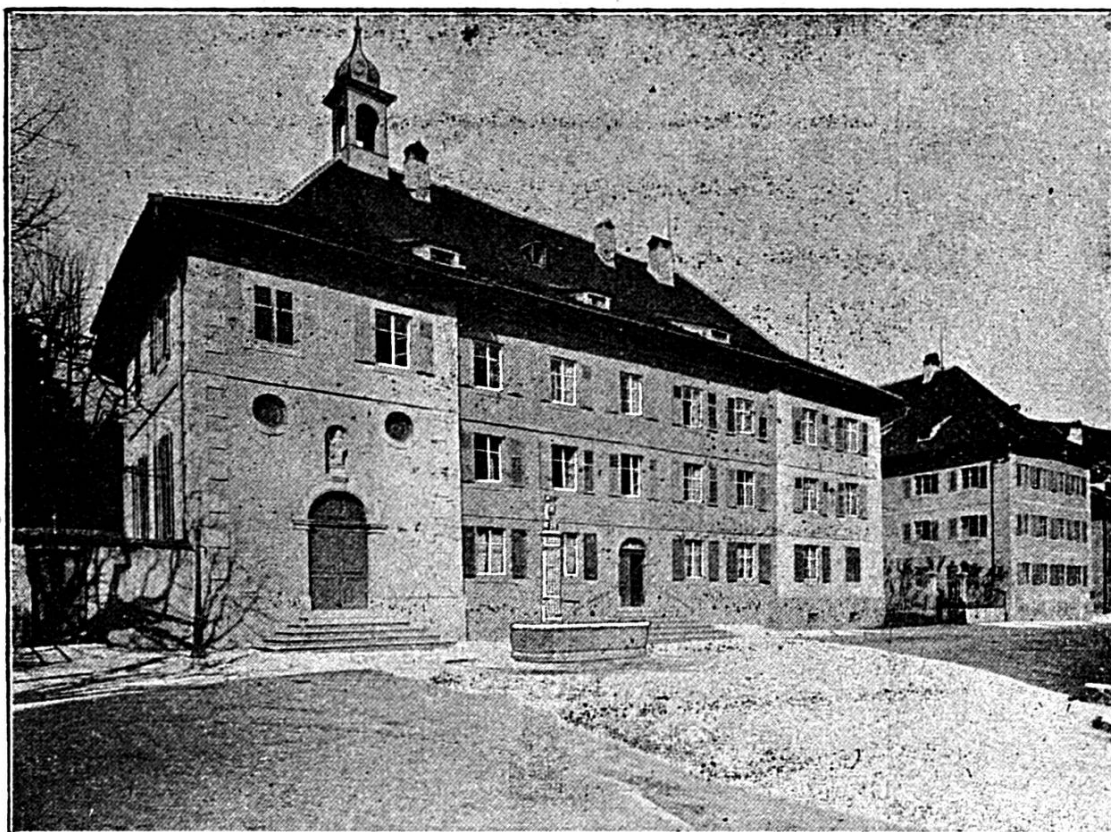
Le Collège et le pensionnat, établis dans l'ancien couvent des Ursulines jusqu'en 1846.

de cet état de choses fut qu'à la fin de 1814 la caisse redevait aux professeurs, pour traitements restés impayés, la somme de 2023,38 fr. (1) Il est vrai que, l'année suivante, la commune trouva moyen de solder son arriéré, et comme, d'autre part, le produit des écolages at-