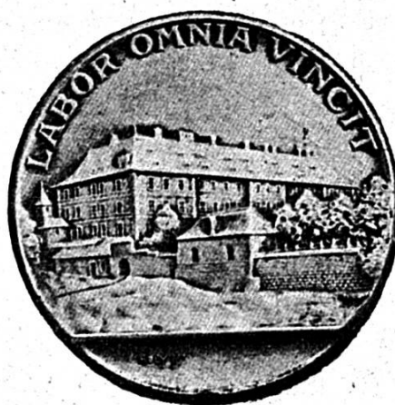
La Médaille du Centenaire