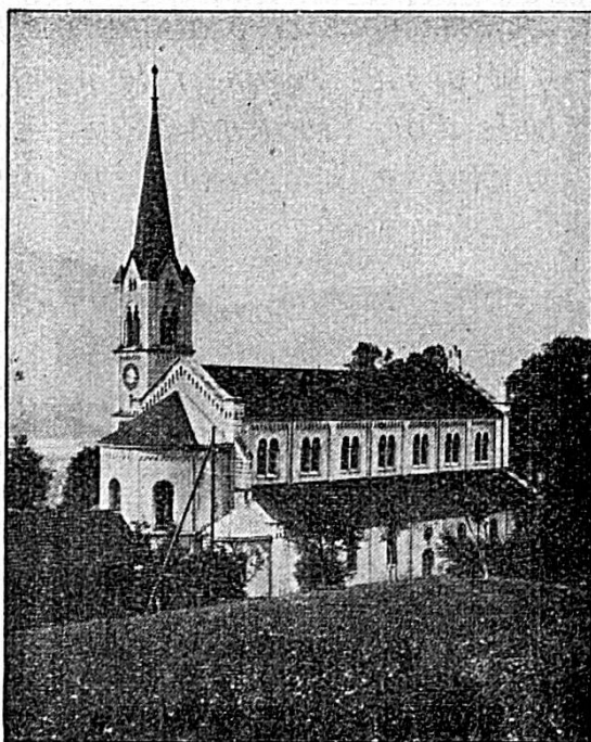
Temple St-Germain reconstruit sur l'emplacement de l'ancienne Collégiale devant lequel fut célébré, le 450 e anniversaire du Traité de combourgeoisie.

Mais le grand privilège de cette alliance de Berne et de la Prévôté, nous le voyons dans une pénétration heureuse des génies de deux races: la race gauloise, qui aime l'industrie, les