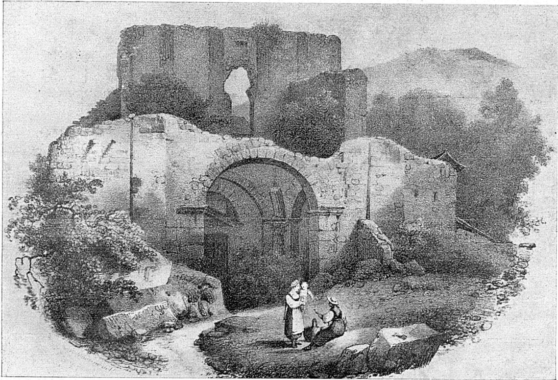
Ruines de la Collégiale de St-Germain, à Moutier-Grandval devant laquelle fut juré le Traité de combourgeoisie du 14 mai 1486