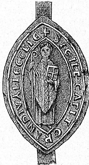
Sceau du Chapitre de Moutier

Comment cette République puissante et ce petit Etat montagnard ont-ils eu la pensée de conclure ce Traité de Combourgeoisie qui devait avoir pour le district de Moutier et le Jura tout entier des conséquences si importantes ?