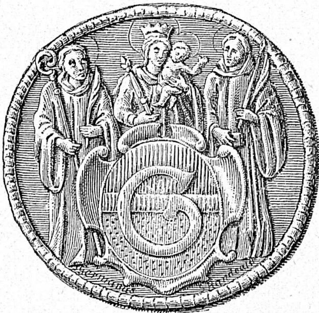
Sceau de l'Abbaye de Moutier-Grandval

Vers la fin du XV me siècle, après les guerres de Bourgogne, Berne était une puissante République qui dirigeait avec beaucoup d'énergie la politique helvétique — et la Prévôté de Moutier-Grandval n'était qu'un modeste Etat de 5539 habitants, presque tous apiculteurs et bûcherons, vivant sous la suzeraineté de l'Evêque de Bâle et à l'ombre tutélaire des deux célèbres monastères de Moutier-Grandval — devenu chapitre de chanoines — et de Bellelay.