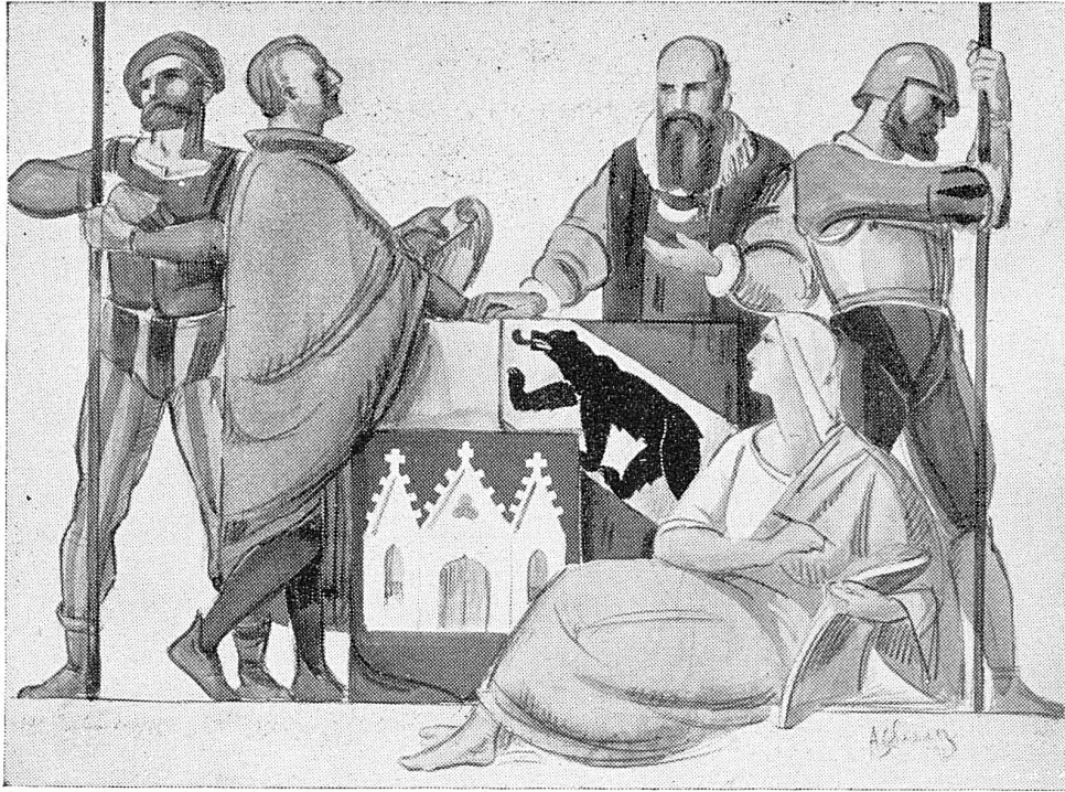
Fresque de la combourgeoisie, à la Nouvelle préfecture de Moutier par M. Schwarz, peintre à Delémont