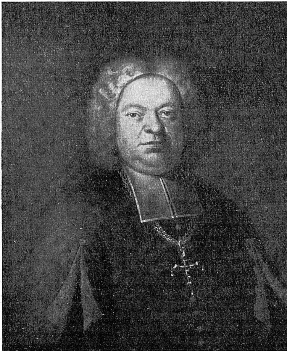
Jean-Conrad de Roggenbach