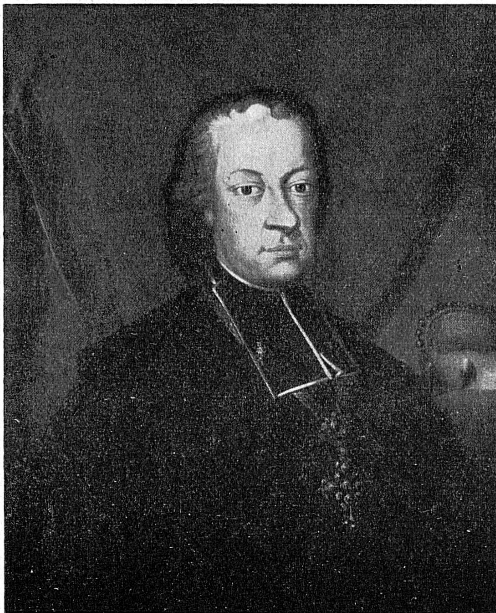
Joseph-Guillaume Rinck de Baldenstein

Trente ans. L'application trop rude de son ordonnance de 1726 déclencha l'agitation et des troubles : la révolte dite des Pétignats. Il mourut en 1737, âgé de 81 ans, après deux attaques d'apoplexie. Il fut enseveli dans le caveau des princes à l'église des Jésuites de Porrentruy, ses entrailles reposent dans la chapelle des Annonciades et son cœur dans le château de sa famille à Hirtzbach.