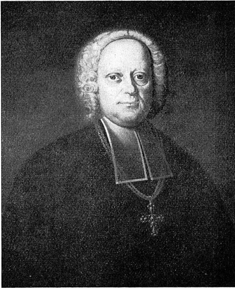
Jacques-Sigismond de Reinach-Steinbrunn

traits de Porrentruy, certainement antérieurs, le présentent portant la calotte et un col blanc noué par un cordon à la mode Louis XIII.