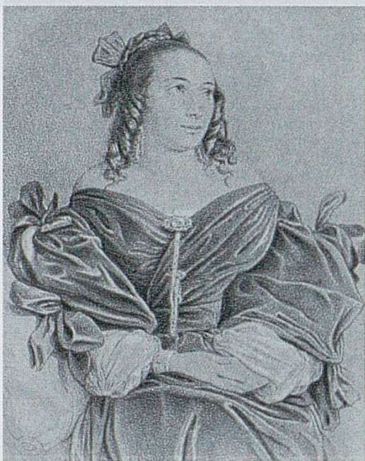
Juliette Drouet en 1832 par Léon Noël.