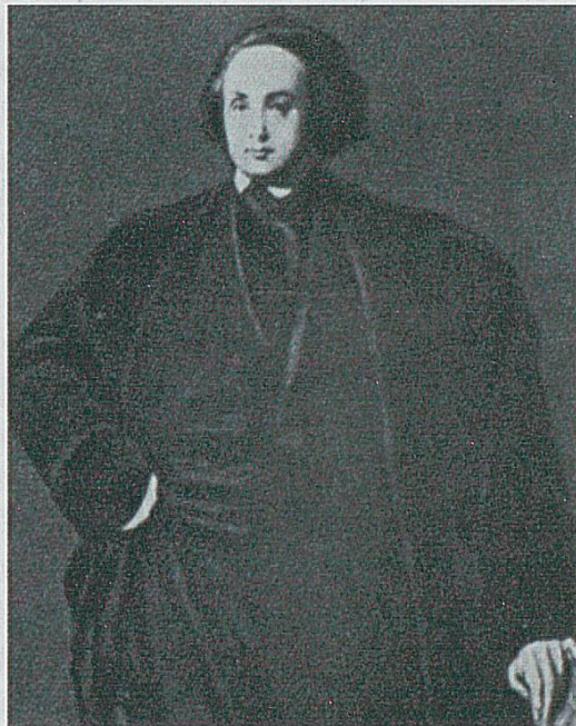
Victor Hugo par Louis Boulanger, Musée Victor Hugo (1834).