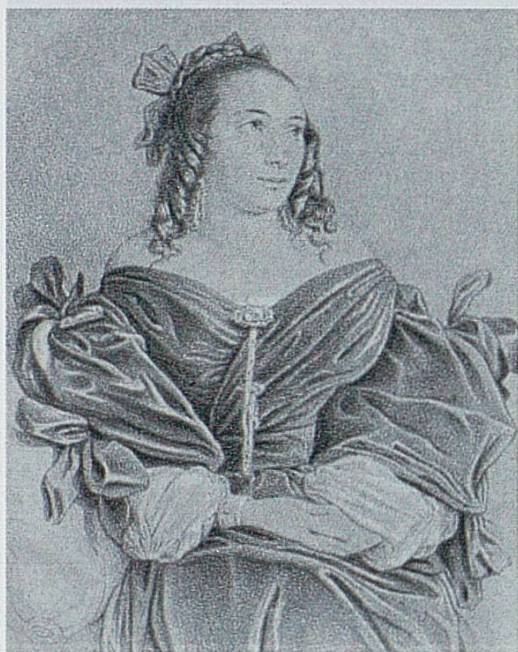
Juliette Drouet en 1832 par Léon Noël.

Juliette est elle-même un personnage tragique. Née Julienne Gauvain en 1806, cette petite Bretonne n'a connu ni père, ni mère. Elle a échoué à Paris, chez une tante et un oncle Drouet, qui vivent chichement d'une maigre rente militaire. Comme le couple habite à proximité d'un couvent de bernardines-bénédictines, l'avenir de la fillette paraît tout tracé: elle finira nonne. Heureusement, une naissance chez la tante Françoise va provoquer un certain détachement chez les parents adoptifs et leur pupille. De plus, le nouveau-né suscite chez l'oncle un brin d'indulgence: Julienne ne deviendra pas religieuse contre son gré. Adolescente donc, intelligente et sensible, elle exerce toute sorte de petits métiers afin de se payer des leçons de peinture chez le «Raphaël des fleurs», Pierre-Joseph Redouté. Non contente de ses progrès en peinture, elle s'inscrit aux cours de sculpture de Jâmes Pradier, où non seulement elle manie habilement le ciseau, mais où elle pose nue, car se dénuder paie! Et la pose finit souvent en pause, au point que Julienne accouche d'une fille, Claire Pradier, en 1826. Elle a tout juste vingt ans. C'est précisément à cette époque que Julienne devient Juliette Drouet et qu'en plus de la peinture et de la sculpture, elle apprend la diction qui la conduit au théâtre de la Porte Saint-Martin. Elle y rencontre le jeune auteur de Lucrèce Borgia , après avoir connu bien d'autres amants: A. Karr, A. Demidoff, l'époux de Mathilde, fille de Jérôme Bonaparte, etc. Juliette