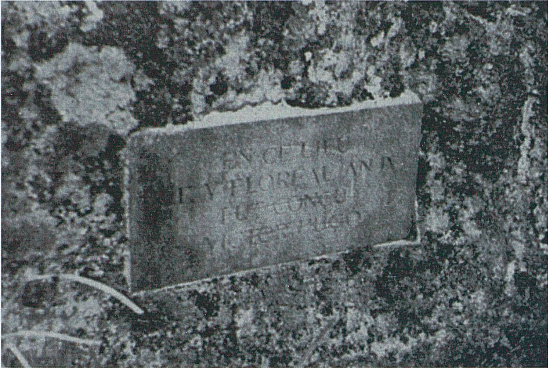
Inscription du Mont Domon.

renvoyer, on le retenait énergiquement, il se décida à vivre.» Quant au père... Dans une thèse soutenue par Geneviève Dormann, celle-ci affirme: «Seuls Dieu et Sophie connaissent la vérité.». Léopold, lui, est sûr de son fait. Dans une lettre du 19 novembre 1821, alors que Victor obtient ses premiers succès littéraires, le général Hugo lui écrit: «Créé non sur le Pinde, mais sur un des pics les plus élevés des Vosges, lors d'un voyage de Lunéville à Besançon, tu sembles te ressembler de cette origine presque aérienne et ta muse est constamment sublime.» Ne sent-on pas sous cette tournure emphatique germer l'hyperbole et l'antithèse hugoliennes du fils, pastichées par Reboux et Muller dans les aventures de Colos-le-Nain et Mignonnette-la-Géante ? Victor écrira, plus tard: