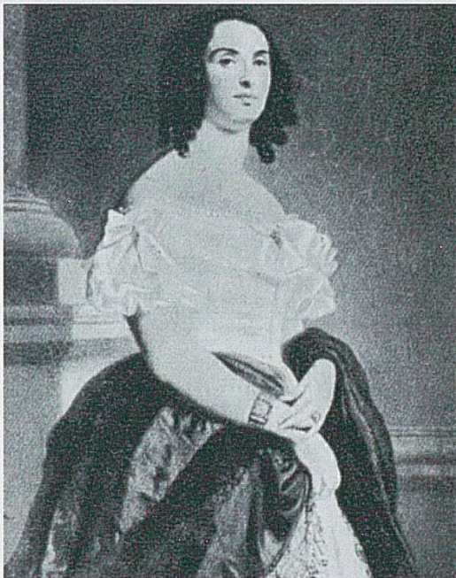
Adèle Hugo par Louis Boulanger, Musée Victor-Hugo (1834).

Une seconde épouse, puisque dès 1834, Victor et elle feront chaque année et jusqu'en 1882 «leur voyage de noces annuel». Une seconde