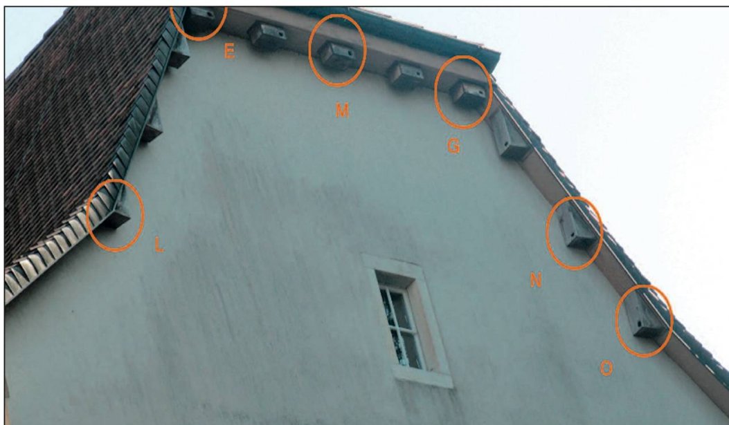
Photo 12. Façade sud de l'aile centrale du bâtiment du Lycée cantonal de Porrentruy, avec, entourés en orange, six nichoirs sur onze (E, G, M, N, et O) occupés par des martinets noirs.