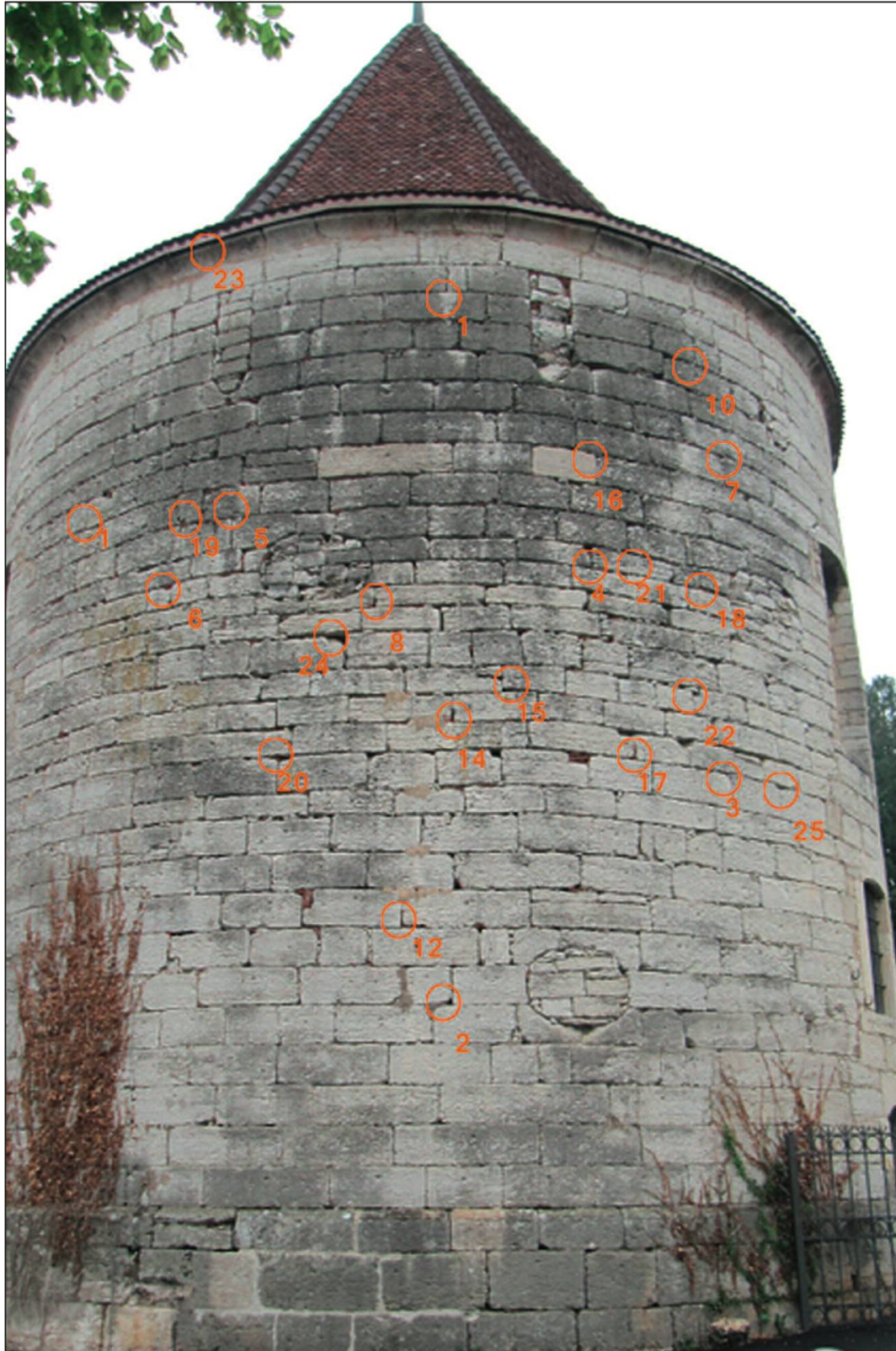
Photo 9. Façade ouest de la tour du Séminaire de Porrentruy, avec, entourés en orange, les vingt-trois emplacements de nids de martinets noirs.