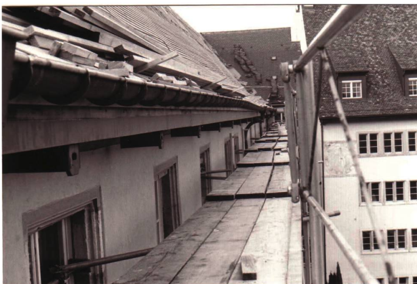
Photo 4. Nichoirs installés sur la façade est de l'aile centrale du bâtiment du Lycée cantonal.