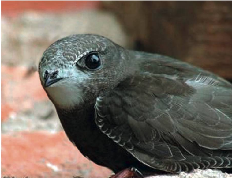
Photo 7. Portrait d'un martinet noir

42 à 48 cm. Il pèse généralement entre 31 et 56 g. Son espérance de vie moyenne est de 4,7 ans avec un âge maximum de vingt et un ans.