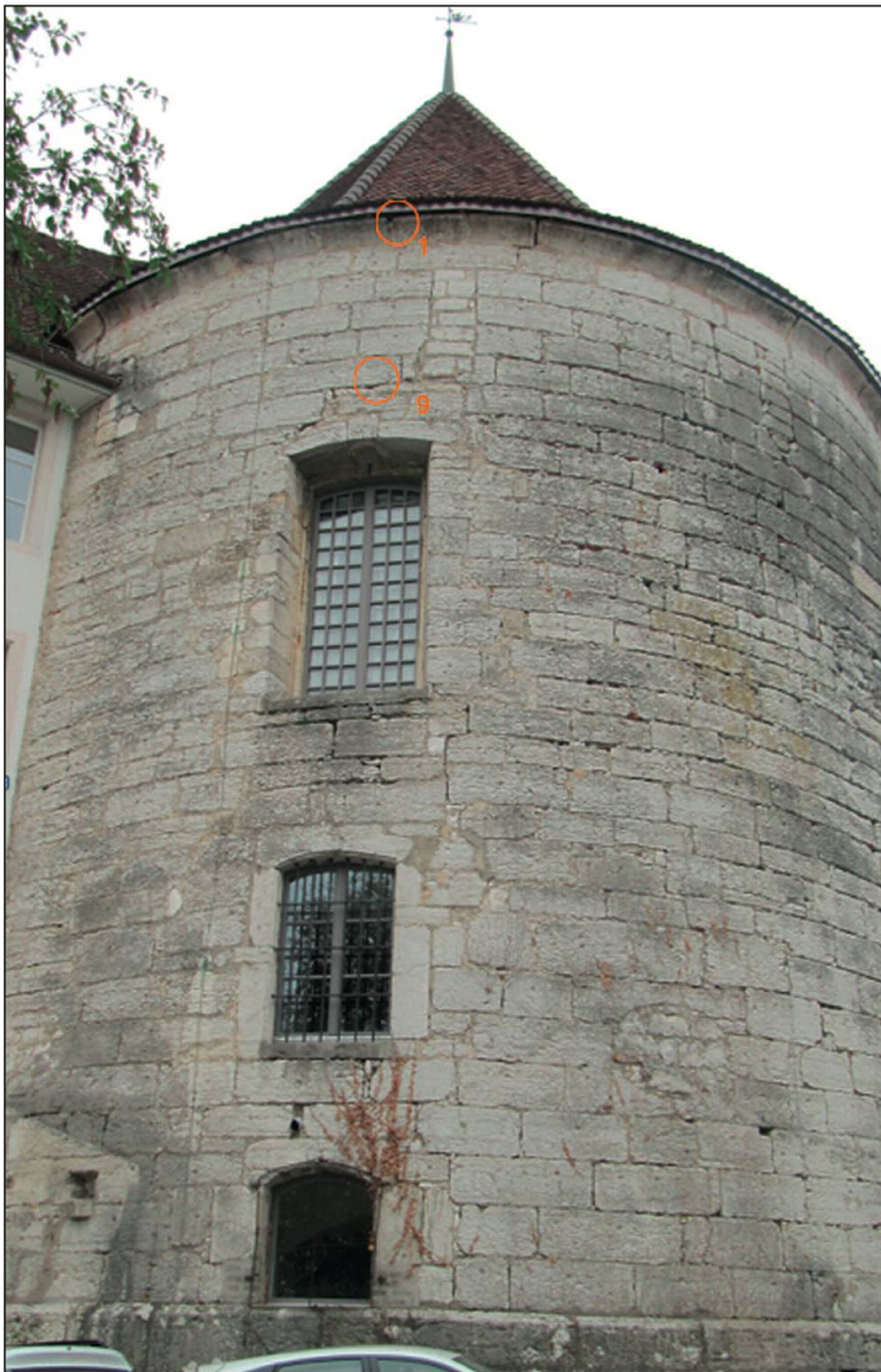
Photo 8. Façade nord de la tour du Séminaire de Porrentruy, avec, entourés en orange, les deux emplacements de nids de martinets noirs.

observés par mes soins par manque de temps. Cependant, les deux tiers sont occupés, selon les observations des employés du jardin botanique (Gérald Burri, comm. pers.). De plus, quelques couples habitent des petites «niches» non colmatées dans certaines corniches et parfois sous les vieilles tuiles, notamment en dessus de la salle D8, côté ouest du bâtiment principal (Philippe Bassin, comm. pers.).