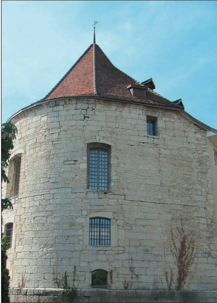
Photo 10. Façade est de la tour du Séminaire de Porrentruy ; aucun nid de martinets noirs n'a été observé.