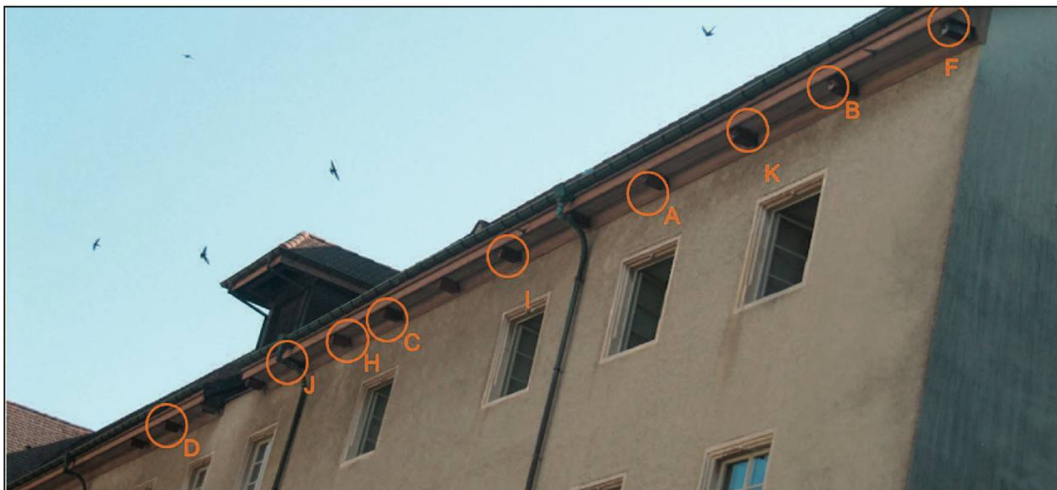
Photo 11. Façade ouest de l'aile centrale du bâtiment du Lycée cantonal de Porrentruy, avec, entourés en orange, neuf nichoirs sur quatorze (A, B, C, D, F, H, I, J et K) occupés par des martinets noirs.