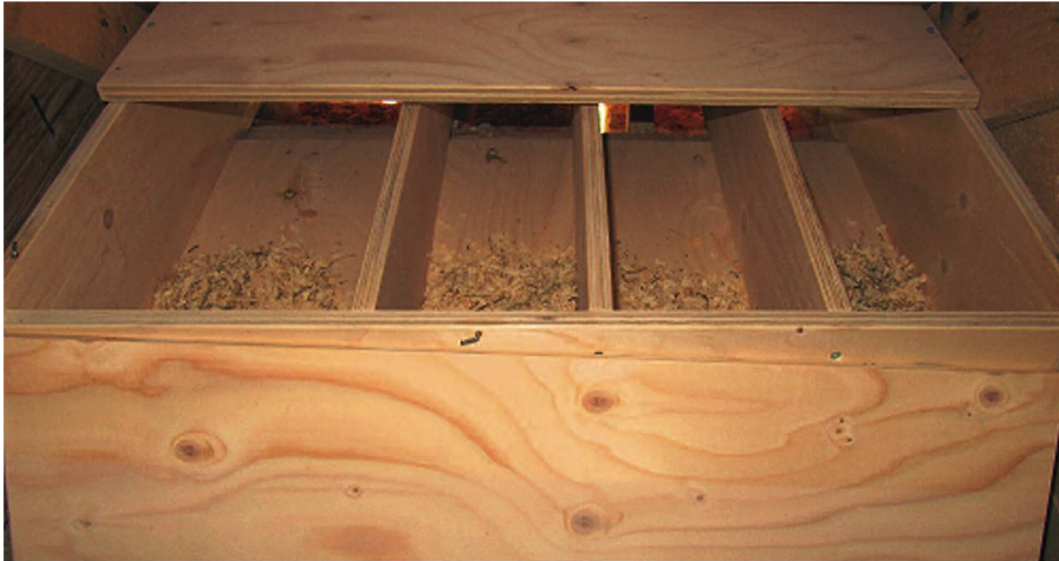
Photo 6. Caisse en bois compartimentée en quatre nichoirs installée sous la toiture de la tour du Séminaire.