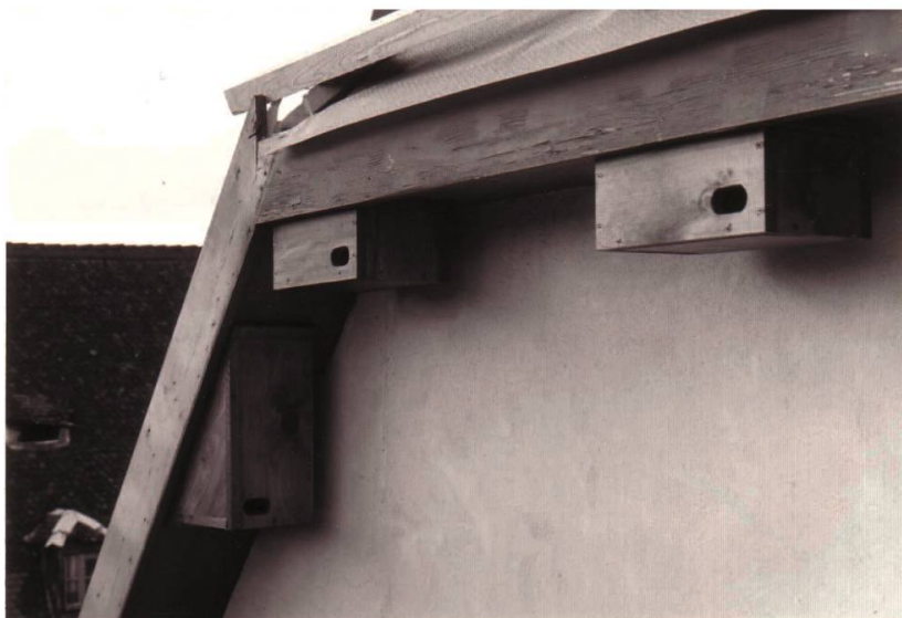
Photo 3. Nichoirs installés sur la façade sud de l'aile centrale du Lycée cantonal.