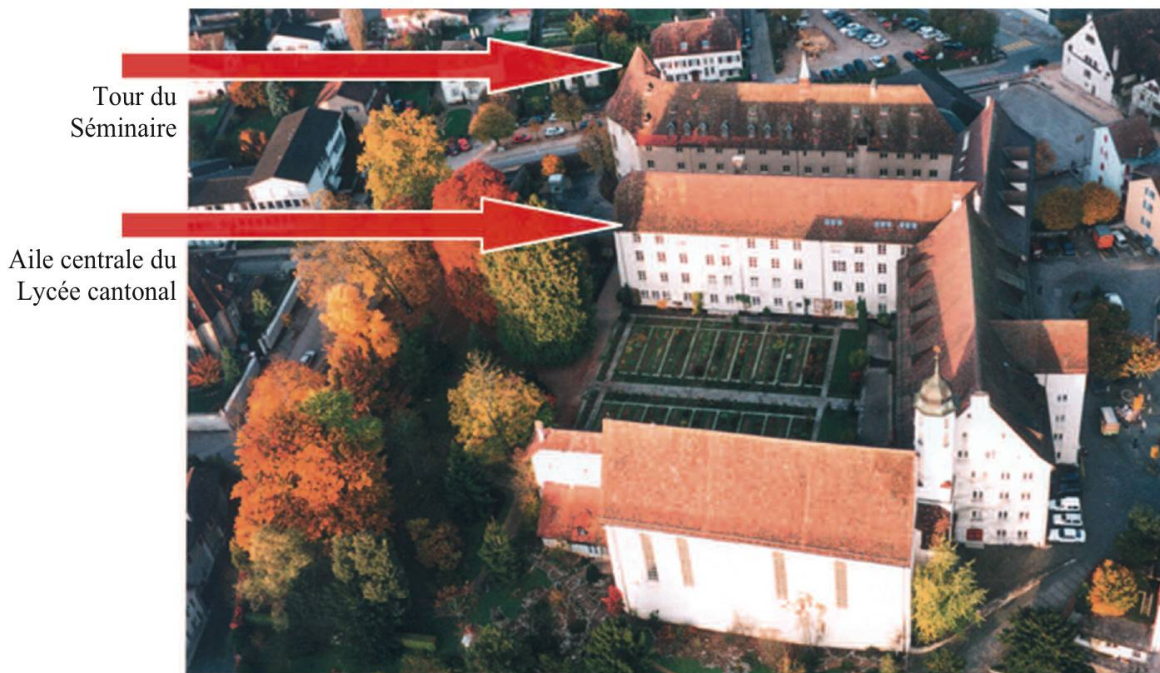
Photo 1. Le complexe des bâtiments du Lycée cantonal et une partie du jardin botanique de Porrentruy. Les martinets noirs nichent principalement dans les anfractuosités de la tour du Séminaire et dans les quarante-cinq nichoirs installés sur l'aile centrale du Lycée cantonal.