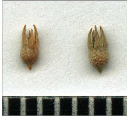
Fig. 4. Détail de deux fleurs de Scleranthus annuus subsp. verticillatus . La longueur inégale des sépales, connivents à maturité, est un critère distinctif de la sous-espèce.

elle possède des fleurs minuscules – 1,5 à 2,5 mm – regroupées en pseudoverticilles distribués tout le long de la tige (fig.3). Ses sépales de longueurs inégales et connivents à maturité (fig.4) la distinguent des autres taxons apparentés ( Scleranthus annuus subsp. polycarpus et Scleranthus annuus s.str.).