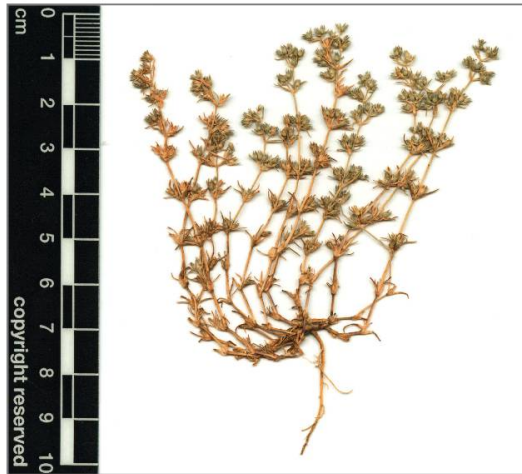
Fig. 3. Exemple d'herbier de Scleranthus annuus subsp. verticillatus issu d'une culture en pot d'un individu récolté à Beurnevésin. En nature, les plantes dépassent rarement les 4-5 cm.