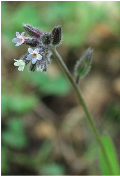
Fig.6. Inflorescence de Myosotis discolor, Beurnevésin, Les Gâbes, le 14.5.2005