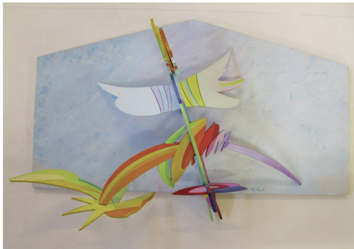
René Myrha, Créature spatiale III , 1992, maquette pour un objet, Centre administratif U.B.S., Genève, acrylique sur carton plume, 29 × 47 × 15,5 cm, coll. musée jurassien des Arts, Moutier.

Avec Créature spatiale III , René Myrha suggère un ailleurs sous le signe de l'envol fantasmagorique et onirique. Son relief dialogue avec la fable de Rose-Marie Pagnard. Le verbe se glisse en filigrane dans cette créature spatiale , lui conférant une nouvelle dimension dramaturgique :