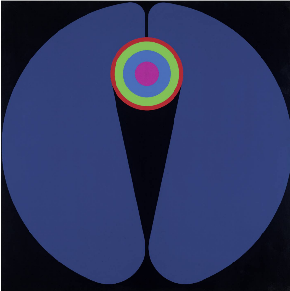
Arthur Jobin, Emblème n° 66 , 1978, acrylique sur bois, 100 × 100 cm, coll. musée jurassien des Arts, Moutier.

L'Emblème n° 66 d'Arthur Jobin invite à une expérience visuelle et méditative que Christine Salvadé décrit, incluant sa dimension tactile :