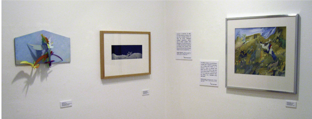
Exposition les Éditions et les Arts , salle 1, avec des œuvres de: René Myrha, Charles-François Duplain, Rose-Marie Zuber.