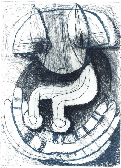
Max Kohler, Chat à 8 queues — Époque apocalyptique , 1966, eau-forte, 30 × 22 cm, coll. musée jurassien des Arts, Moutier.

Christine Salvadé, « Arthur Jobin, architecte de la couleur », in : Actes de la S.J.É. , vol. 99, 1996, p.73-75.