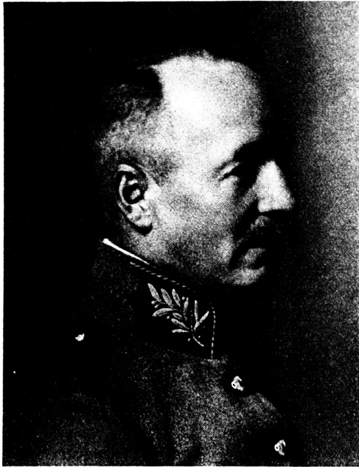
Oberstkorpskommandant Ulrich Wille

tung, der Kampfcharakter des Blattes, lebte wieder auf und die Richtung gebende Persönlichkeit des Redaktors behauptete aufs neue ihren Platz.