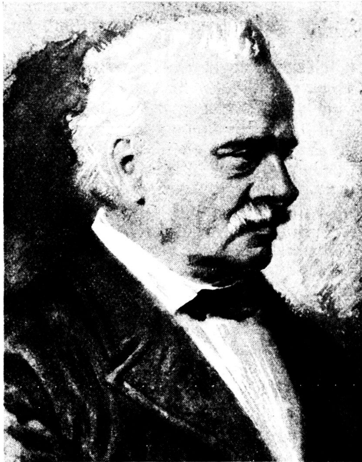
Commandant Friedrich Rudolf Walthard 1805—1874

Bemühungen durch zahlreiche Subscriptionen zu unterstützen. Sollten bis zum 20. Januar 1840 nicht eine zur Deckung der Kosten hinlängliche Anzahl von Subscriptionen eingegangen sein, so würde die Zeitschrift nicht mehr erscheinen. Dieser in Aussicht gestellte schmachvolle Ausgang wurde allerdings vermieden. Die Zeitschrift fristete weiter ihr kümmerliches Dasein. Doch es ging bergab mit ihr. Wie es scheint, kam der Herausgeber nicht mehr recht dazu, dem Blatt die nötige Sorgfalt zu widmen; der 1840 erfolgte Tod Uebels beraubte es des anregendsten Mitarbeiters und, um die Verlegenheit voll zu machen, kam der gänzliche Rücktritt Lohbauers dazu. Man sah, so konnte es nicht mehr weitergehen. Da entschloss sich, im Jahre 1846, ein Kreis von Offizieren, eine neue Grundlage zu schaffen. Der eidgenössische Oberst Albert Kurz war die treibende Kraft.