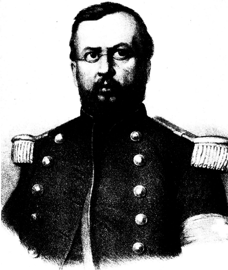
Oberst Hans Wieland 1825—1864

den zu beschreiten die Liebe zum Vaterland und der Glaube an seine Zukunft ihm Kraft gaben. Ohne Beschönigung sollten gerade die Mängel des Milizsystems blossgelegt, ihre Ursache ergründet und ihr Fortbestehen nach Möglichkeit verhindert werden. Fern von Liebedienerei, doch darum nicht taktlos, ging Wieland unbeirrt den Schäden zu Leibe. In der ungenügend kriegerischen Bildung des Offizierskorps sah er die Wurzel der Unzulänglichkeit; für die geistige Hebung der Offiziere durch Unterricht in den Kriegswissenschaften und nicht minder durch Erziehung zur Uneigennützigkeit und Opferbereitschaft sollte die Zeitschrift eingesetzt werden. Im Bewusstsein seiner Kräfte