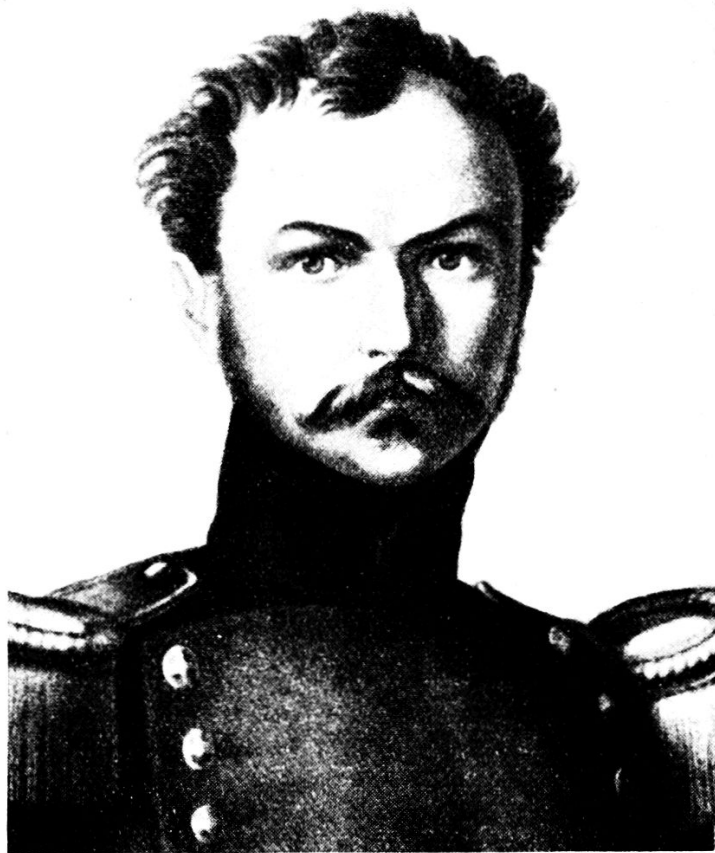
Oberstlt. Bruno Uebel 1806—1840

und Decker, vortreffliche Lehrer; daneben besuchte er in dienstfreien Stunden philosophische Vorlesungen an der Berliner Universität. Diese für einen Berufsoffizier ungewöhnliche Leidenschaft machte den einzigen Bürgerlichen im feudalen Regiment nicht besonders beliebt; als eine für seinen Stand völlig abwegige Fraternisierung mit etlichen Polen dazu kam, wurde die Atmosphäre so getrübt, dass Uebel es vorzog, freiwillig den Dienst zu quittieren und sich ins Ausland zu begeben, um dort seinen freiheitlichen Sympathien leben zu können. Wie andere erwartete Uebel einen gewaltsamen Bruch der Verhältnisse. Er erwartete den Krieg und von diesem Krieg die Wiedergeburt Deutschlands, des einen Staates, unter der Führung eines hervorragenden Soldaten. Das demokratische Prinzip, das einen andern Bereich seiner Gedankenwelt belegte, sollte im provinziellen Rahmen Anwendung finden.