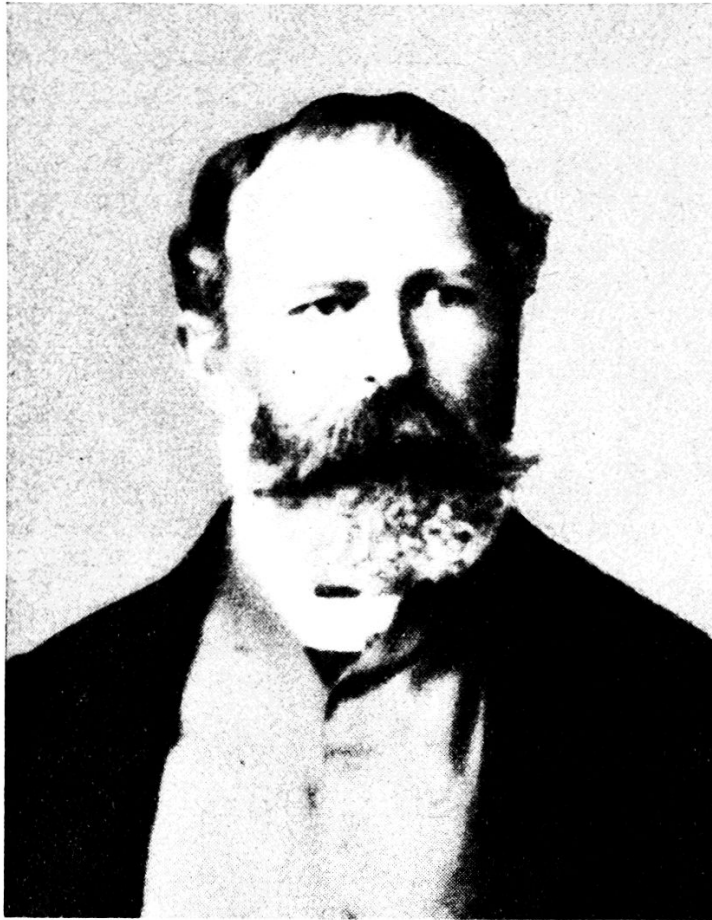
Professor Rudolf Lohbauer 1802–1873

stät durchzog der junge Lohbauer Franken; er kam nach Nürnberg und Würzburg, und dankte den alten Stätten der Kultur und der herrlichen Landschaft künstlerische Anregung. Nach Ludwigsburg zurückgekehrt, wandte er sich nun der freien Kunst zu. Illustrationen zu Mozarts «Don Juan» wurden veröffentlicht. Die Wirkungen der Julirevolution führten ihn zur burschenschaftlichen Betätigung zurück. Als Redaktor des freiheitsdurstigen «Hochwächter» schuf er sich Namen und Feindschaft. Der Bogen brach, als Lohbauer eine Sammlung zensurierter Artikel in Buchform vereinigte und als «Der Hochwächter ohne Zensur» in Pforzheim herausgab. Flüchtig erreichte er Strassburg. Dort traf er unter andern Bruno Uebel, mit dem ihn von nun an dauernde Freundschaft verband. Beide wandten sich der Schweiz zu. Im April 1833 langten sie in Burgdorf an. Uebel zog nach Zürich, während Lohbauer, wie erwähnt, bei Bauinspektor Roller Aufnahme und, besonders an den berühmten «Samstagen» im Stadthause, Gesinnungsgenossen und Freundschaft fand. Ungefähr 2 Jahre weilte Lohbauer, der mancherorts und besonders durch militärische Kenntnisse in Offizierskreisen sich gut ein-