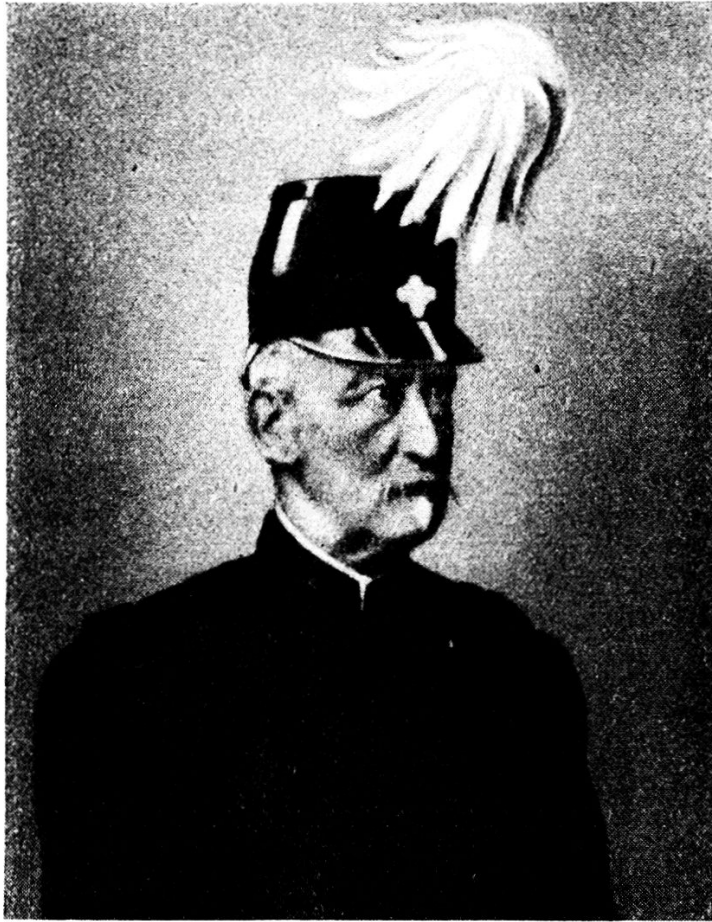
Oberstkorpskdt. Joh. Heinrich Wieland 1822—1894

nächtliches Lager der Nationalversammlung durchzuführen, damit man sich über Wert und Notwendigkeit des geforderten Ausrüstungsgegenstandes klar werden möchte.