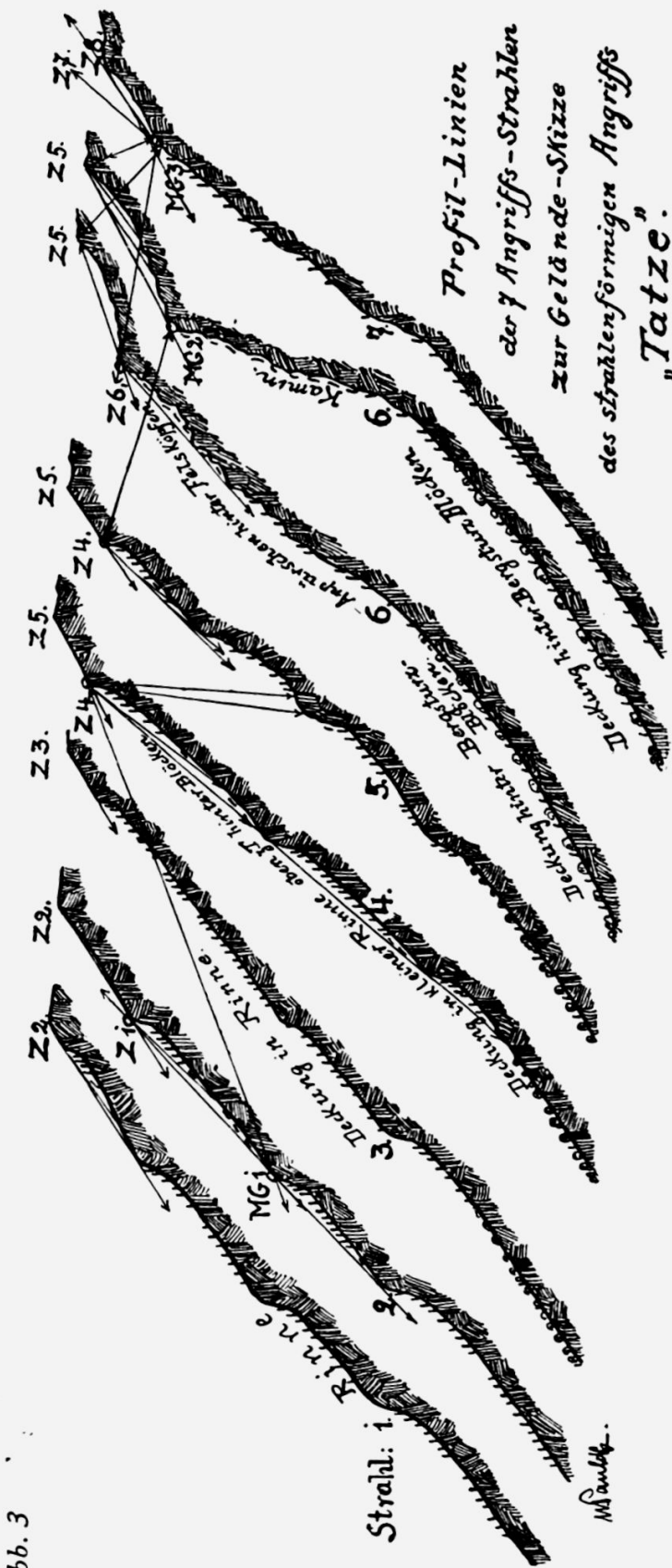
Abb. 2. «Strahlenförmiger Angriff» auf eine Höhenstellung: «die Tätze». — Erläuterung: Z. = Ziele vom feindl. rechten Flügel aus durchnummeriert. — Z. 2, Z. 3, Z. 5, Z. 7, Z. 8 feindliche Stützpunktstellungen. — Z. 1, Z. 4, Z. 6 vorgeschobene Mg. Stellungen. — H. P. Horchposten.

A. = Bereitstellung bei Nacht, Ausgangsstellung. — Strahl i—7: Angriffslinien für die Stosstrupp-Kolonnen. Vorarbeiten unter Ausnutzung der Geländegestaltung: Tote Winkel, Wald, Bergsturzblöcke etc. Falls Gefahr vorbereiteter Steinlawinen droht, Vordringen aus den Rinnen gegen die begrenzenden Gratrücken verlegen. — Mg. 1, 2 und 3: Von Angreifer vorgetriebene Mg. zum Feuerschutz und Niederkämpfen der vorgeschobenen feindl. Mg. — F. 1 bis F. 5: Eigene Mg., Mw., Art. Stellungen für Feuerschutz von einer der feindlichen gegenüberliegenden Höhe aus. — Die Skizze des «strahlenförmigen» Angriffs der «Tätze» kann als Schema für Unternehmungen im Kleinen wie sinngemäss von solchen grossen und grössten Stils dienen. Das Grundsätzliche bleibt sich gleich.