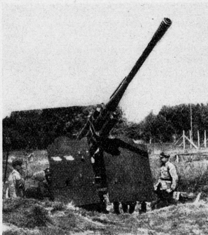
85-mm-Flab Modell 39/42 mit Schutzschild

12,2-cm-Feldhaubitze Mod. 38 (auch als Selbstfahrlafette T 34)