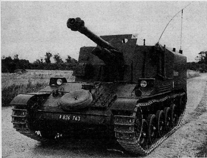
Frühes Modell der Selbstfahrraubitze, in dem der Kampfraum nicht als drehbarer Turm konstruiert ist

Die Streitkräfte aller Staaten werden gegenwärtig einer besonders tiefgreifenden Umgestaltung unterzogen. Beweglichkeit und Feuerkraft stehen dabei im Vordergrund der Bestrebungen zur Modernisierung.